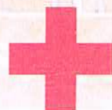
日本赤十字社 Japanese Red Cross Society

概ね2~3秒のうちに動画が始まりますが、電波状況により反応が遅い場合もあります。また、対応機種以外では見られません。