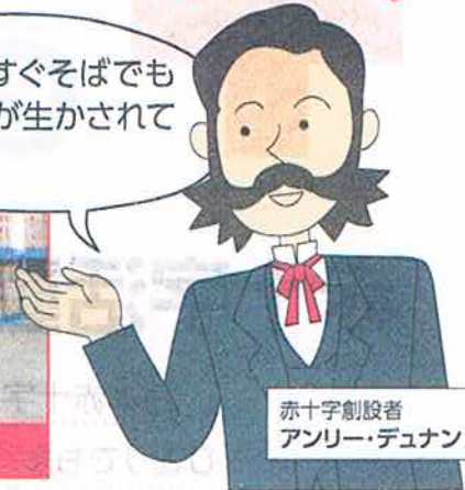
赤十字創設者 アンリー・デュナン