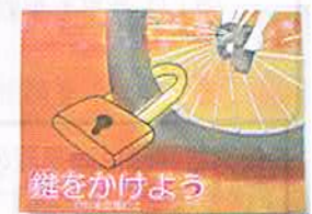
特別賞 川崎市立東高津 1年 手塚 胡桃