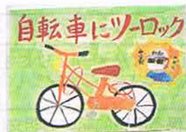
優秀賞 横浜市立太尾 6年 渡辺 玲奈