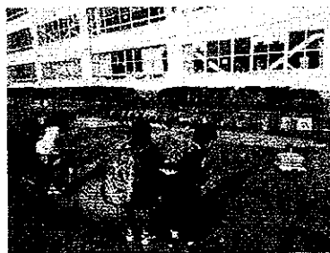
【水消火器的当てゲーム】

11月22日(土)に推進協の主催による子ども大会がありました。「香川 kids ~ミッションと防災体験にチャレンジ~」というテーマで、約300名の子どもたちが参加しました。