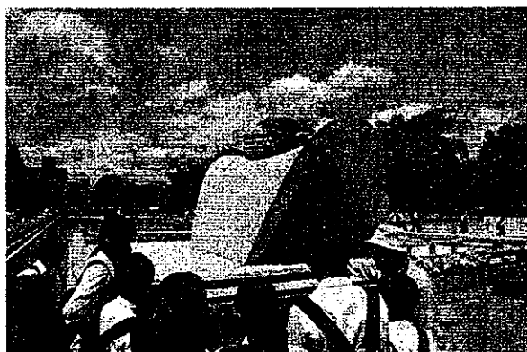
(原爆死没者慰霊碑前で)

さて、本校としては、初の広島修学旅行を実施しましたので、広島での様子を少し紹介します。第1日に訪れた広島では、まず班ごとにボランティアガイドさんの案内で平和記念公園を歩きました。原爆ドーム周辺を巡り、原爆死没者慰霊碑(広島平和都市記念碑)で祈りを捧げるなどした後、平和記念資料館を各自見学しました。事前学習が良くできていたのだと思います。熱心に見学する生徒が多く、感動しました。私は最後に入館し、じっくり見ていたつもりですが、いつの間にか、多くの生徒が私より後で見学しており、時間が足りないくらいでした。最後に代表生徒が原爆の子の像の後ろにあるケースに折り鶴を奉納しました。限られた時間ではありますが、平和について考える貴重な機会になったと思います。余談ではありますが、平和記念公園内では多くの外国人に出会いました。また、原爆ドーム周辺では、写生をしている人を多く見かけました。