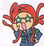
こわくなったら おおごえて