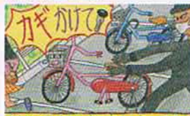
だれかが自転車を盗んでる! 最優秀賞 横浜市立中田小 5年 嶋本 彩夢