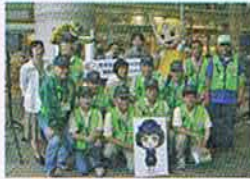
横須賀防犯協会 防犯啓発キャンペーン

問合せ先 神奈川県自転車商協同組合 045-311-6168 http://www.kanasho.jp