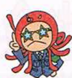
だまされて ついていかない