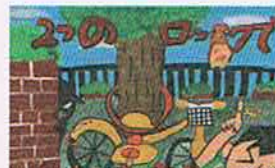
2つのロード 優秀賞 海老名市立杉本小 5年 中島 陽菜子