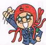
おうちのひとにいきます