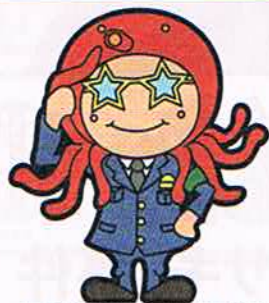
僕の名前は、おおだこポリス