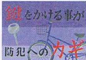
鍵をかける事が 防犯への力 優秀賞 横浜市立中和田中 3年 清水 千穂