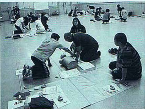
○行政研修 (年2回) <写真はAED講習>