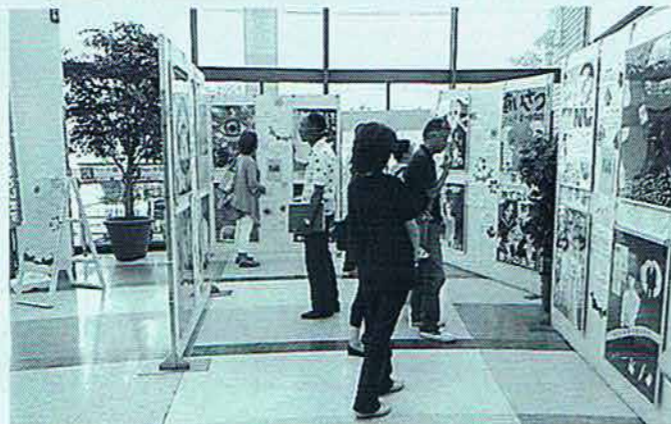
○青少年健全育成ポスター展示 (7月)

青少年健全育成の啓発や社会環境浄化を目的として、市内の公立13校の中学生が作成したポスターを展示しています。