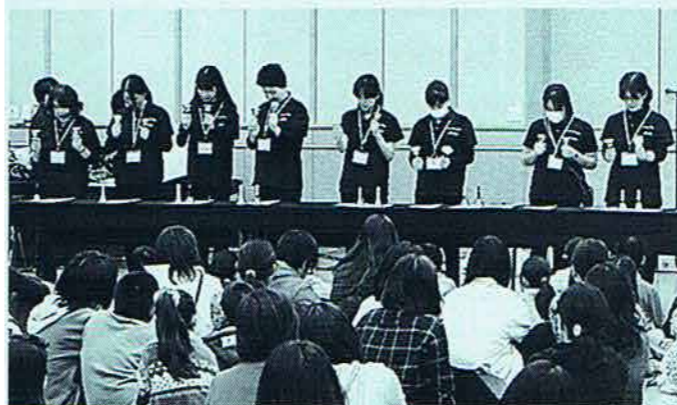
◇ゲームセミナー (3月)