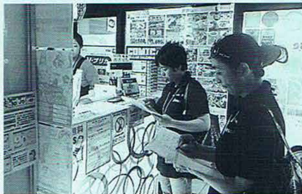
◇社会環境実態調査 (7月~9月)

青少年健全育成の啓発や社会環境浄化を目的として、市内の公立13校の中学生が作成したポスターを展示しています。