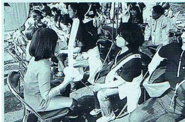
○市民ふれあいまつり (11月)