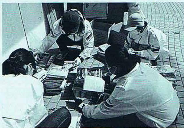
○有書図書回収 (年12回)