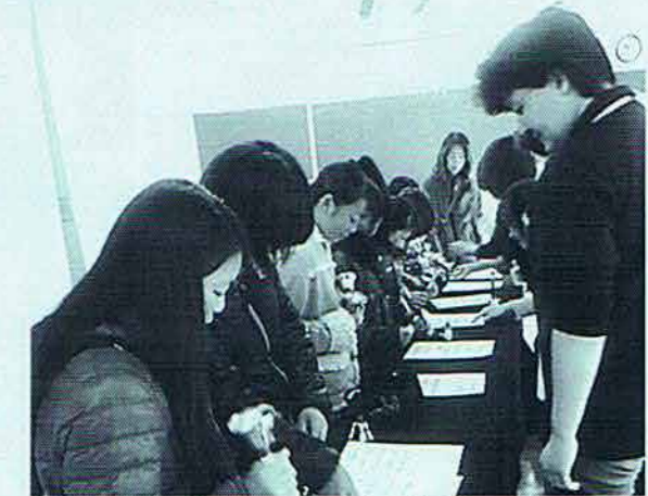
◇青少年会館フェスタ (11月)