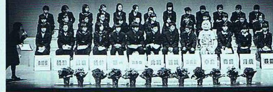
○青少年育成のつどい (1月)

青少年の健全育成の大切さを市民のみなさんに知っていただくことと地域の青少年活動の活性化を図ることを目的としています。