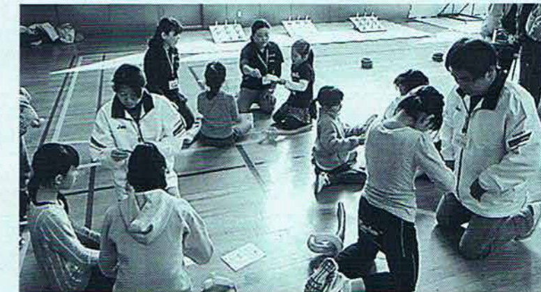
◇ちがさきスポーツ・レクリエーションフェスティバル (3月)