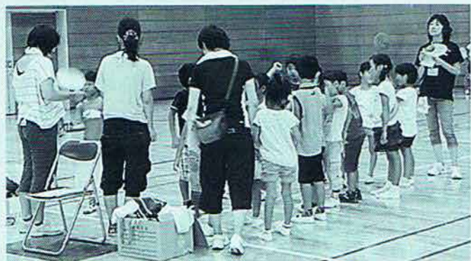
◇子ども会交流事業 (8月)