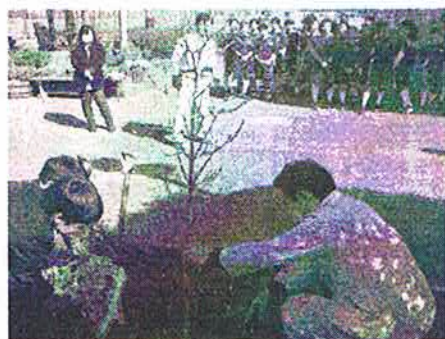
(ハナミズキの植樹)