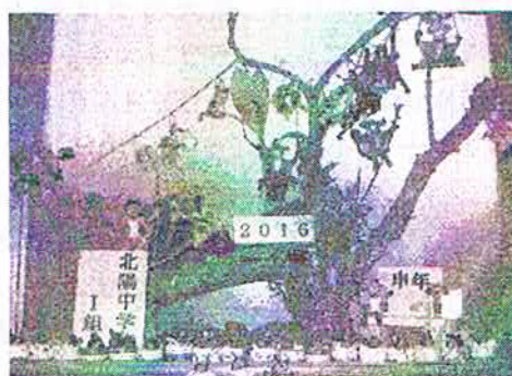
(1組 みんななかま展、出品作より)