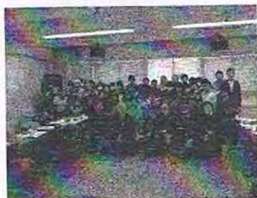
（見守り隊員と6年1組の児童）

2月29日（月）に香川小学校プール北側の横断歩道で子どもたちを見守っていただいている地域ボランティアの安全見守り隊の打ち合わせ会がありました。現在は約40名弱の方々に毎日旗振りをしていただいています。今回は、次のようなご意見がありました。