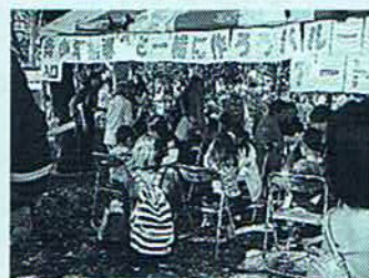
市民ふれあいまつり