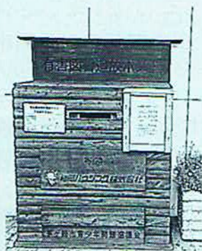
有害図書追放ポスト

青少年補導員制度の廃止に伴い、平成18年4月から青少年指導員が回収をしています。