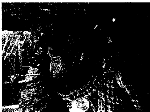
(I組校外学習、はまぎんこども宇宙科学館)