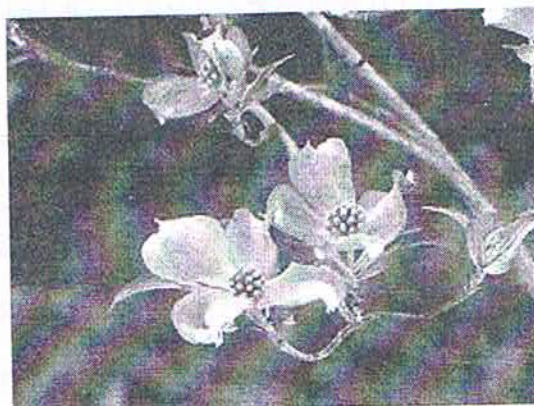
(開花したハナミズキ)