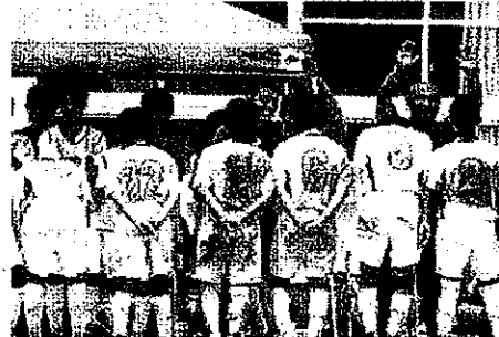
(地区総合体育大会より)