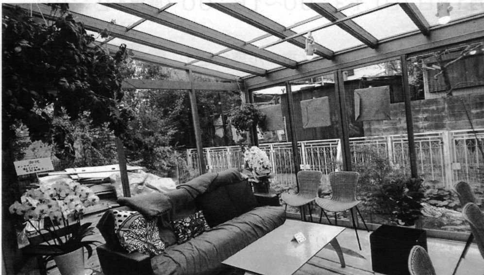
空き家を改修しカフェとして活用した事例写真②

※お送りいただく個人情報は、今回のシンポジウムに関わる目的以外 には利用いたしません。