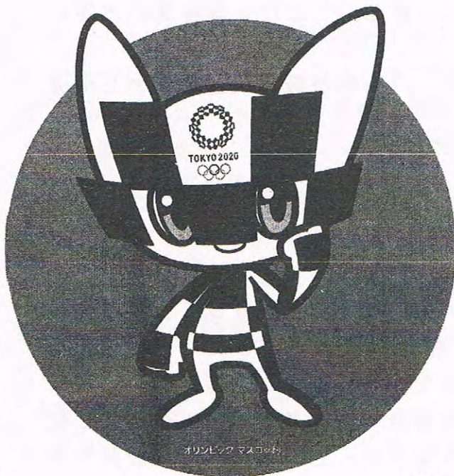
オリンピックマスコット