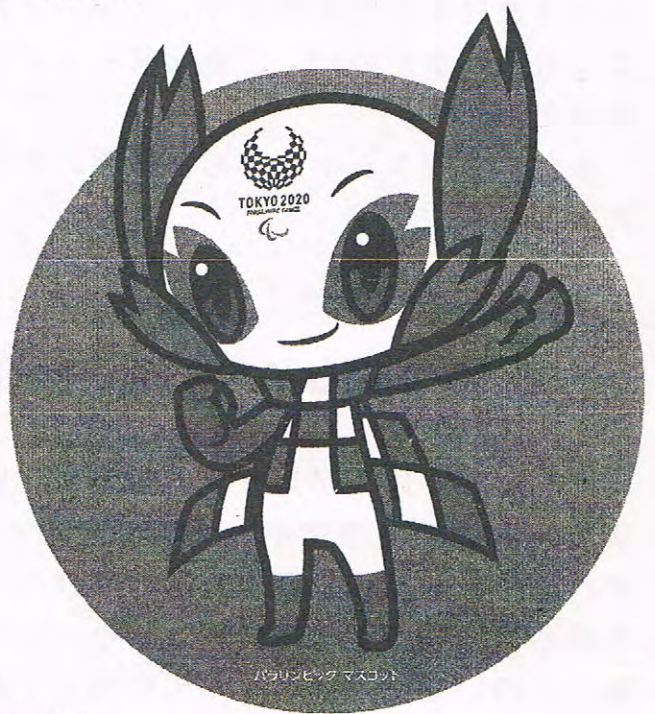
パラリンピックマスコット