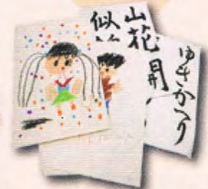
習字やクレヨンで描いた紙

その他、アイロンプリント紙、感熱発泡紙（熱を加えると盛り上がる紙）なども、燃やせるごみに出してください。