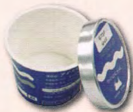
アイスクリームのカップ