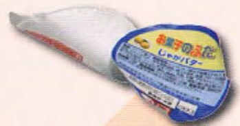
裏がアルミ貼りのお菓子の箱 お菓子やカップ麺のふた