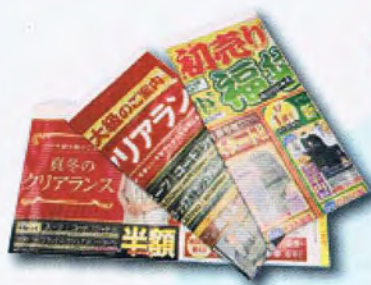
ダイレクトメール