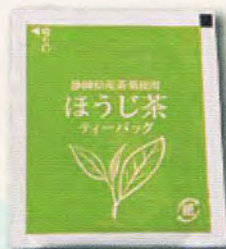
ティーバッグの袋