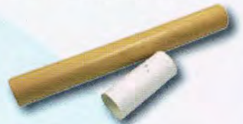
ラップ・アルミホイル・ トイレトペーパーの芯