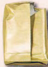
たばこの銀紙・金紙