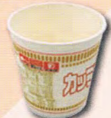
カップ麺のカップ