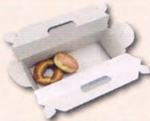
ドーナツやケーキ等の入った箱