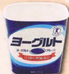
ヨーグルトの容器