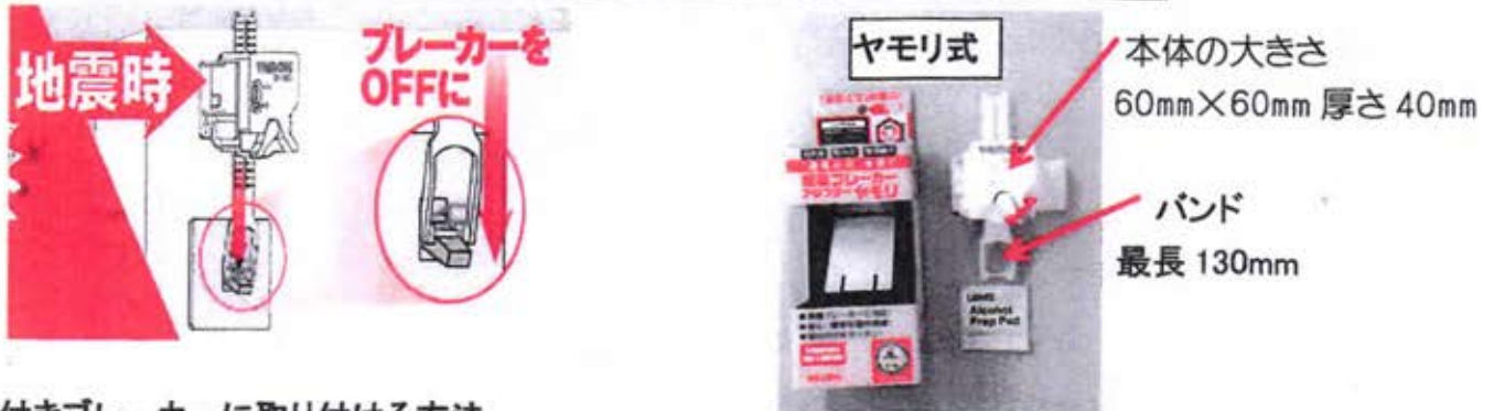
蓋付きブレーカーに取り付ける方法 (写真1)