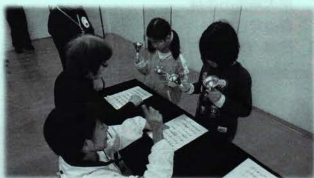
青少年会館フェスタ