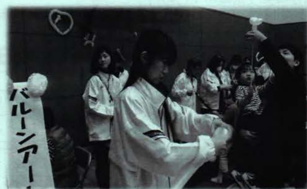
ちがさきスポーツ・レクリエーション フェスティバル