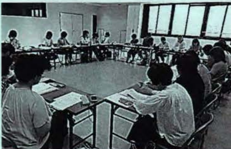
理事会での情報の共有