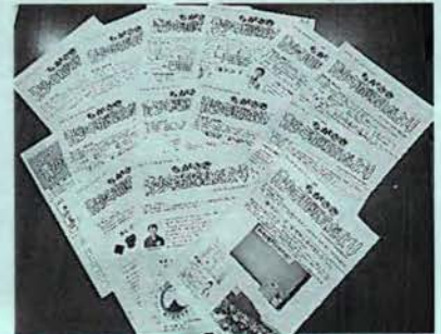
青少年指導員だより作成・発行