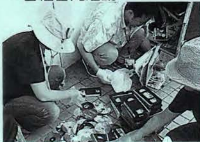
有害図書類の分別・回収