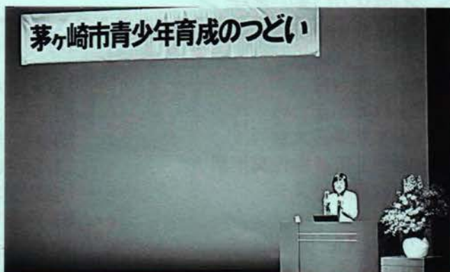
青少年育成のつどい