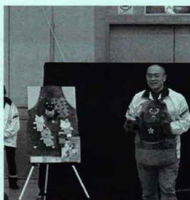
子ども会新役員研修会