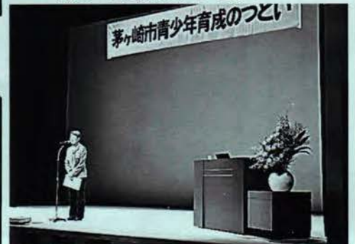
青少年育成のつどいの企画・運営