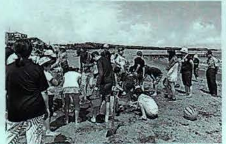
遊び体験教室の引率・見守り