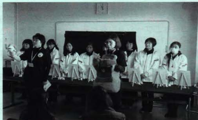
県立茅ヶ崎養護学校文化祭 〈きらめき祭〉