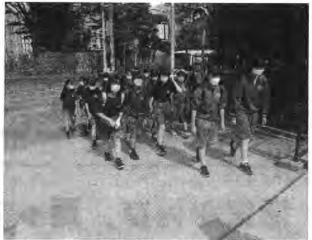
(朝の登校風景です)