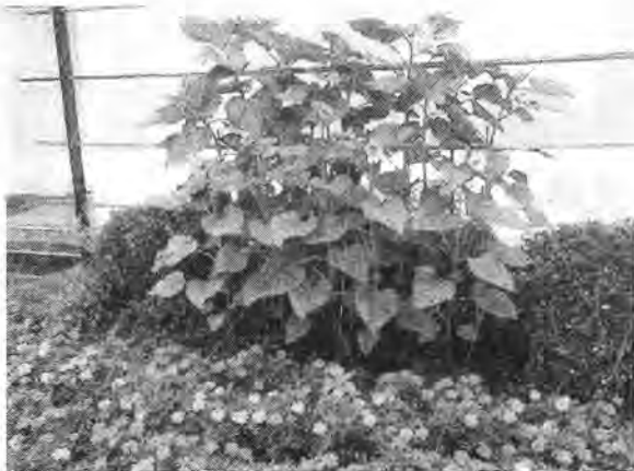
(体育館前に今年もヒマワリが咲きました)

これからの3年間は保護者の皆様からは経済的な支援(交通費や道具類の購入など)をはじめ、日頃の洗濯、お弁当の準備など、数多くの支援が必要となります。ぜひとも本校の部活動にご理解、ご協力をお願いします。