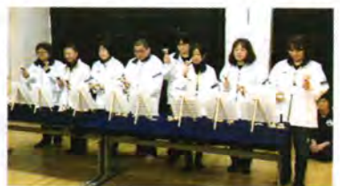
県立茅ヶ崎養護学校文化祭