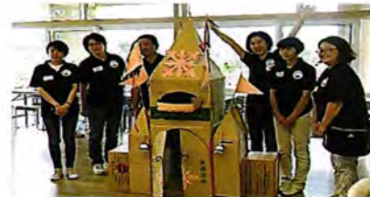
行政研修 青少年指導員としての資質向上をはかる研修です