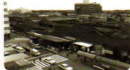
1985年頃、解体前の茅ヶ崎駅