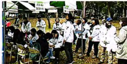
市民ふれあいまつり 青少年健全育成ポスター展示やバルーンアートの指導を行います