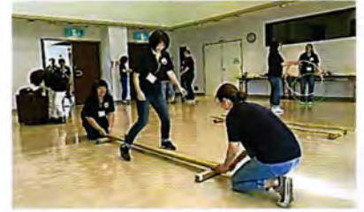
指導員研修 各自のスキルアップのための研修会です