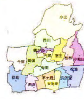
1985年頃 人口：約185,000人 世帯数：約57,000世帯