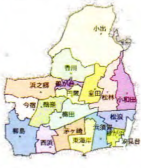
2019年頃 人口：約242,000人 世帯数：約103,000世帯