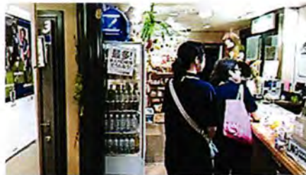
社会環境実態調査 県から委託され各店舗の実態調査を行います