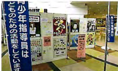
青少年健全育成ポスター展示 市立中学校に依頼し生徒がポスターを制作しています