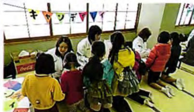
青少年育成のつどい 講演会や子どもたちに向けてまつりなど企画開催しています