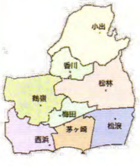
1965年頃 人口：約100,000人 世帯数：約25,500世帯