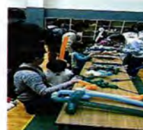
ちがさきスポーツ・レクリエーションフェスティバル