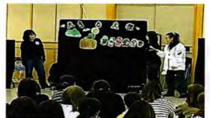
子ども会新役員研修会 新役員の方々に子ども向けのゲームや備品を紹介しています