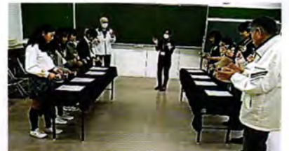
青少年会館フェスタ 子どもたちがミュージックペルを体験しています