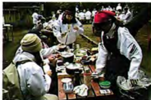
全体会 青少年指導員の交流を深める事業です