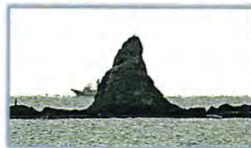
茅ヶ崎サザン C の中から見える「えぼし岩」 ロゴマークのイメージ

え：笑顔があふれる研修しながら ぼ：ボランティアで健全育成の活動 し：市民のみなさんに広報紙などで い：いっぱい活動を知ってほしい わ：私たちは青少年指導員です