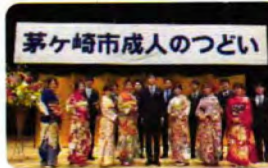
※毎年、市内中学校卒業生の代表と青少年指導員の代表が実行委員として活動しています