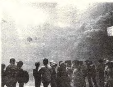
いろいろな水槽の前で、真剣に魚たちを見る2年生