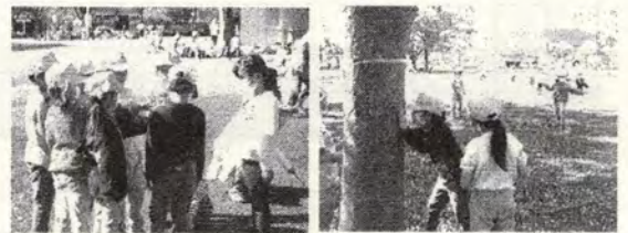
上:だるまさんが転んだをしてあそぶ 下:小物づくり

11月18日(木)には、新江ノ島水族館に遠足に行きました。水族館見学の後に海にも行きました。