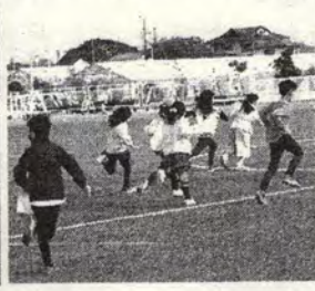
フィールドを走ってみました