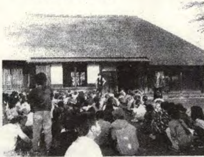
旧和田家を訪ねて

19日(金)校外学習で市内めぐりに出かけました。柳島スポーツ公園、茅ヶ崎図書館、茅ヶ崎美術館、市営球場でお弁当、そして旧和田家を見学。自分たちの住む香川小学区と違う茅ヶ崎を感じたことでしょう。