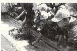
タッチプールで魚に触れる

26日(金)新江ノ島水族館に行ってきました。水族館の中では、どの水槽の前でもよく見ていました。ショーも拍手をいっぱいして楽しんでいました。バスの中のお弁当・おやつタイムも楽しんでいたようです。