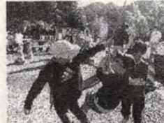
放水の迫力を間近で