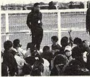
スポーツ公園で質問