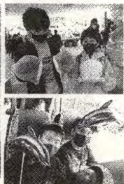
おみやげも買いました