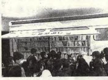
移動図書館しおかぜ号