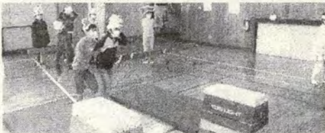
3組<楽ジャングルアスレチック>