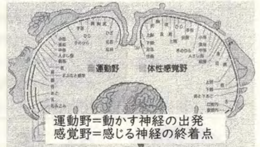
運動野=動かす神経の出発 感覚野=感じる神経の終着点

程度で使えることが可能にはなっています。 しかし、成長には個人差があり、箸の使い方や鉛筆などの持ち方、その他の道具の使い方は徐々に変化し、持ちやすい動きになります。小学校では【柄が細く指先を細かく使う】鉛筆等を使用する事が増えます。文字を書く時間も長くなり、細かい動きや持久力に加えて、集中力が必要となります。指先をたくさん使う事や細かい動きが多いため、最初は疲れやすいです。その他に、鉛筆や箸が苦手にならないような配慮もしながら、鉛筆や箸以外にも様々な手先の動きに合わせて器用に手を動かせるようになる事が大切です。