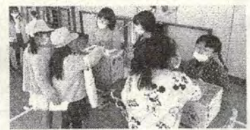
5組<ビックリハンドボックス>