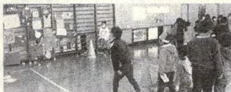
4組<うちゅうのまとあて>