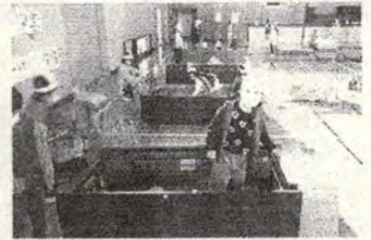
2組<キラクロボーリング>