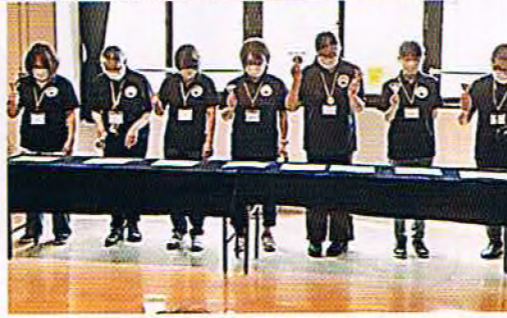
ミュージックベル