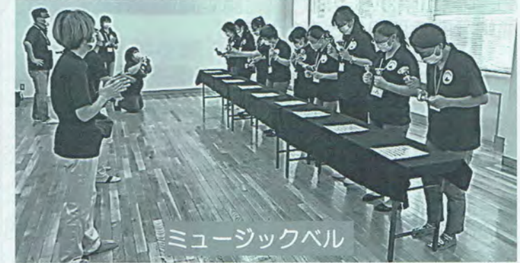
ミュージックベル

「指導員研修」を実施しました。ミュージックベル、アイスブレイキング、パネルシアター、バンブーダンス、ベーゴマ、カードゲームを実施して、子ども会の依頼などに対応できるようにスキル向上を図りました。