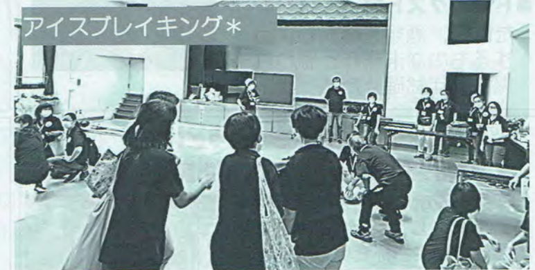
アイスブレイキング*

*アイスブレイキング 初めて会う人同士が「氷を溶かす」ように、その場の緊張をとほぐし、コミュニケーションをスムーズにして目的を達成するための手法のこと。