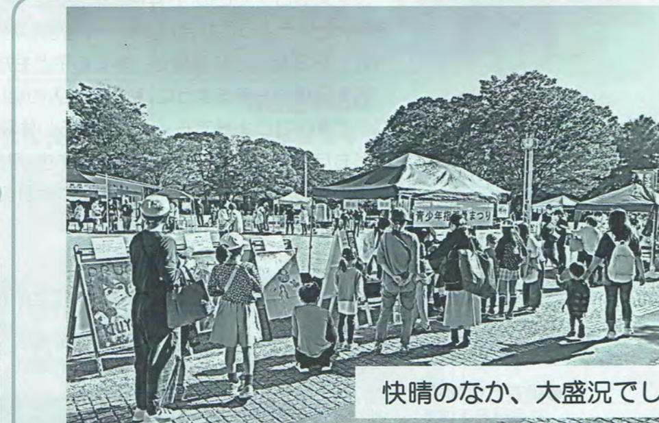
快晴のなか、大盛況でした