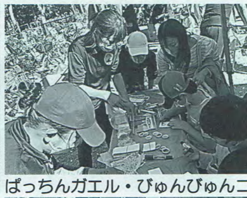
ぱちんガエル・びゅんびゅん