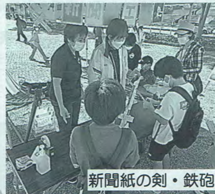
新聞紙の剣・鉄砲