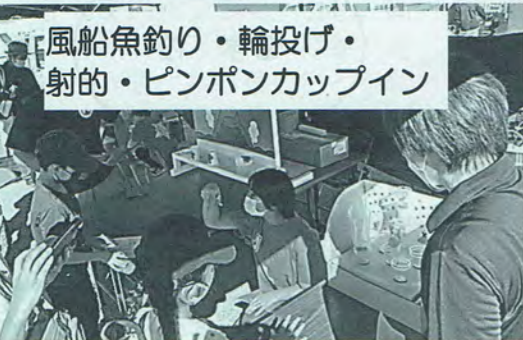
風船魚釣り・輪投げ・射的・ピンポンカップイン