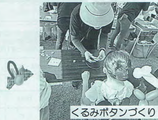
くるみボタンづくり