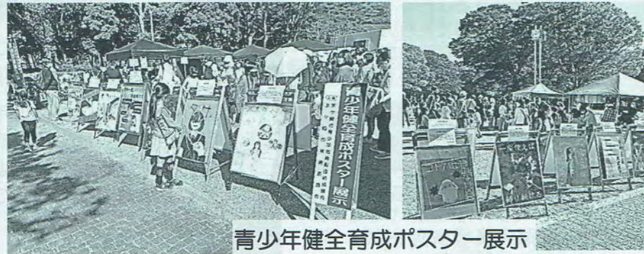
青少年健全育成ポスター展示