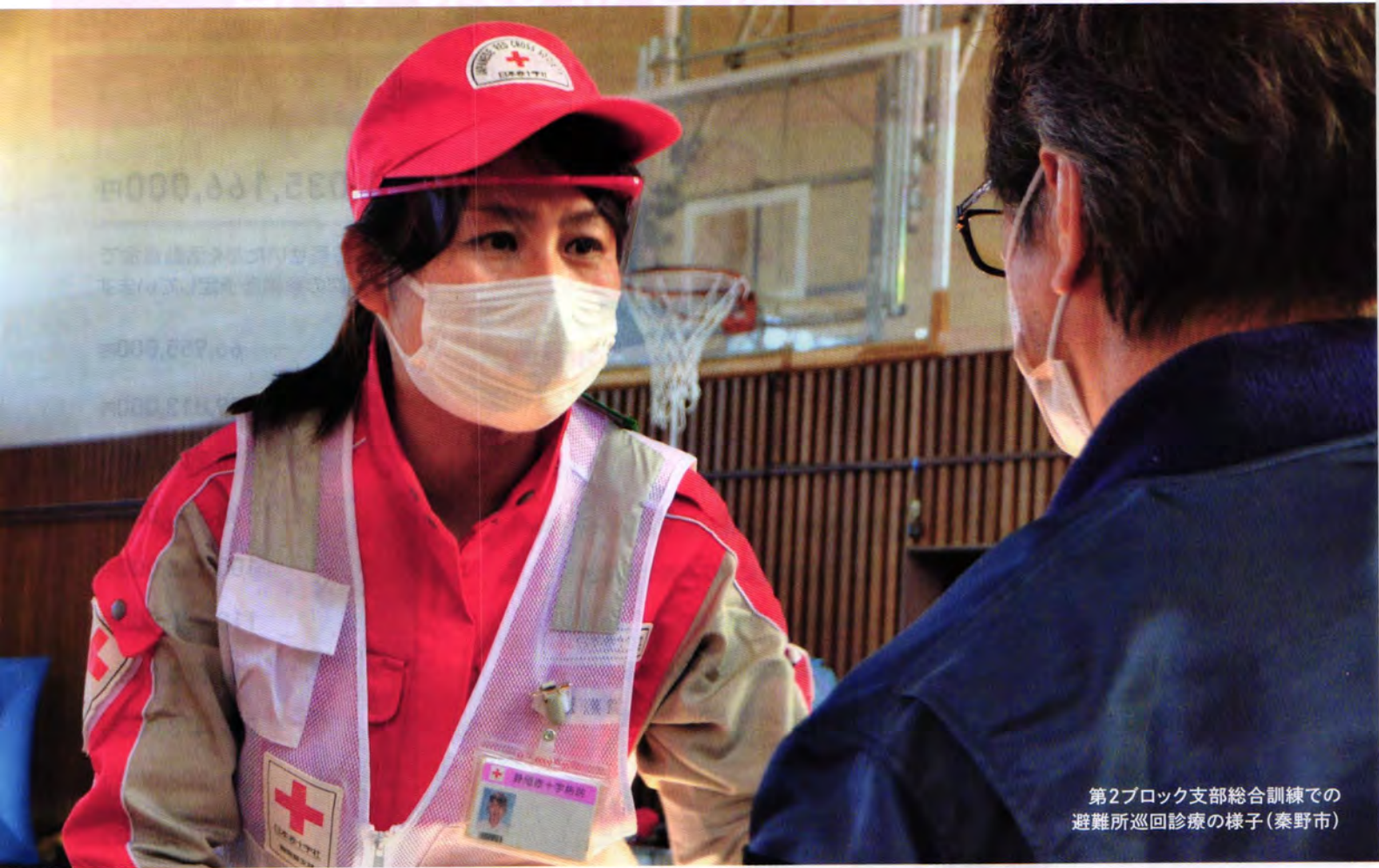
第2ブロック支部総合訓練での 避難所巡回診療の様子(秦野市)