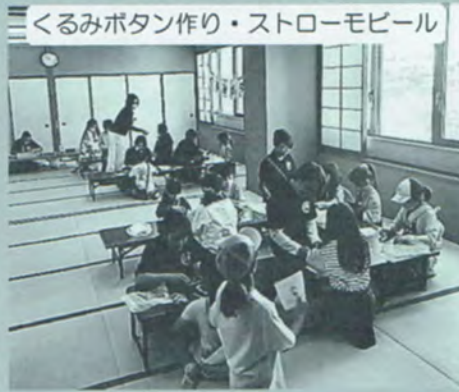
くるみボタン作り・ストローモビール