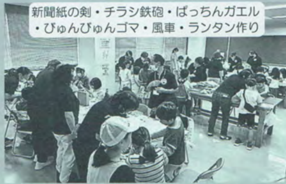
新聞紙の剣・チラン鉄砲・ばっちゃんガエル ・びゅんびゅんゴマ・風車・ランタン作り