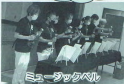
ミュージックベル

各学区の推進協や子ども会などの活動に生かせるレクリエーションのスキル向上のため、ミュージックベル、アイスブレイキング、パネルシアター、バンブーダンス、ベゴマ、カードゲームなどの研修を行いました。