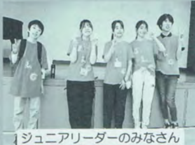
ジュニアリーダーのみなさん