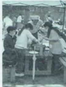
(ちがさき柳島キャンプ場にて)