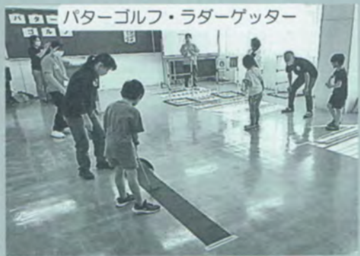
バターゴルフ・ラダーゲッター