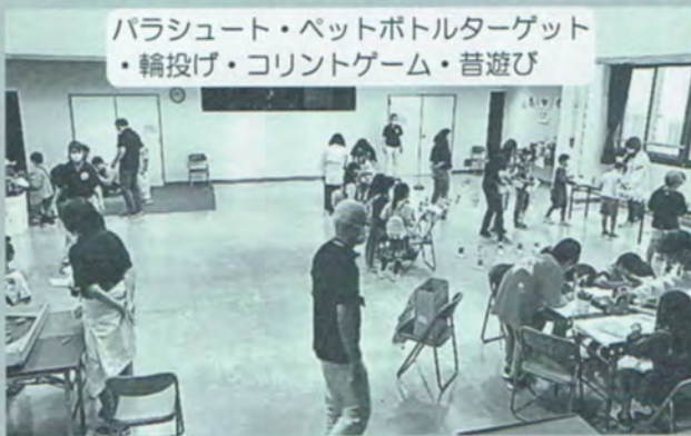
パラシュート・ペットボトルターゲット ・輪投げ・コリントゲーム・昔遊び