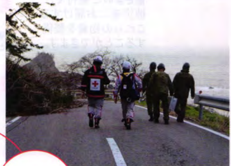
▲寸断された道路を自衛隊員と進む同救護班(石川県珠洲市)