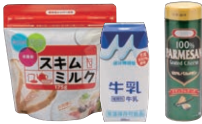
ロングライフ牛乳・粉チーズ・スキムミルク