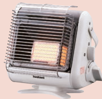
カセットボンベで使えるガストーブ ▲