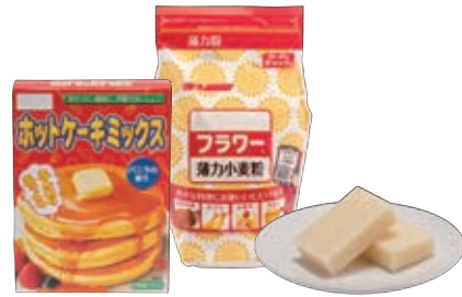
小麦粉・米粉・餅