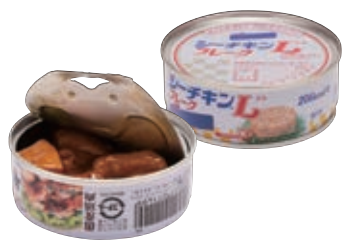
肉・魚・豆などの缶詰