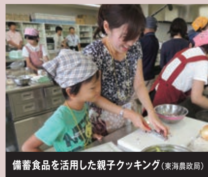
備蓄食品を活用した親子クッキング(東海農政局)