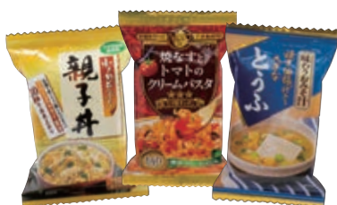
フリーズドライソース類