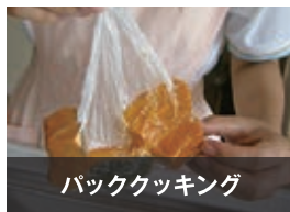
パッククッキング

断水時には、まな板もきちんと洗えない状態となりますので、まな板を使わず、キッチンバサミを使って空中で食べ物をカットし調理する方法です。