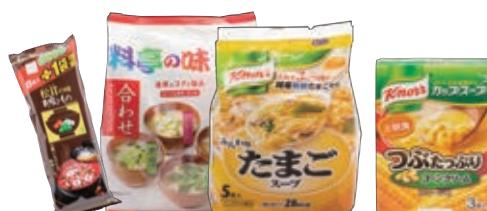
インスタントみそ汁、即席スープ等