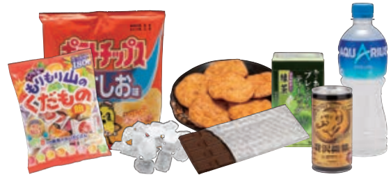
各種菓子・嗜好品