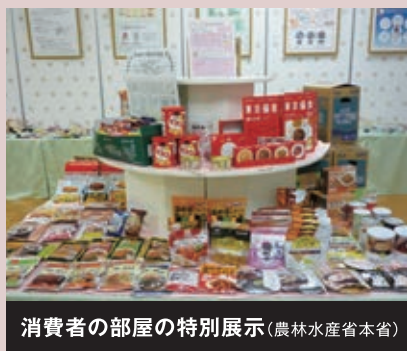
消費者の部屋の特別展示(農林水産省本省)

農林水産省では、食料安全保障の観点から、家庭備蓄の普及に向けて、省内外での展示や防災イベントへの参画、各種ガイド、リーフレット、動画の作成・普及、政府広報の活用等を積極的に行っています。