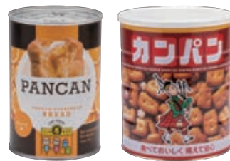
缶詰パン・乾パン