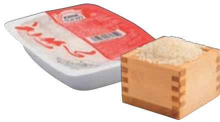
精米・無洗米・パックご飯等