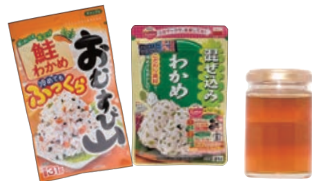
ふりかけ・ジャム・はちみつ等