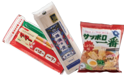
乾麺・即席麺・カップ麺