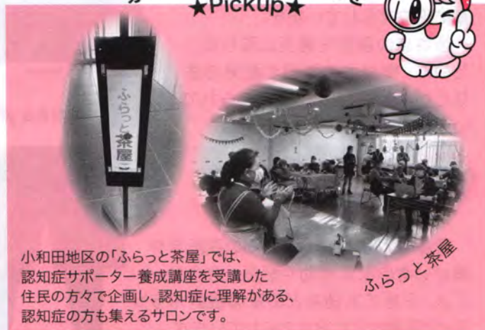
小和田地区の「ふらっと茶屋」では、認知症サポーター養成講座を受講した住民の方々が企画し、認知症に理解がある、認知症の方も集えるサロンです。