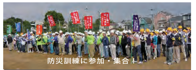
防災訓練に参加・集合!