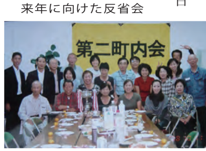
来年に向けた反省会

9月25日 月例夜間パトロールを実施。参加者6名で、じり貧傾向、防犯意識の高揚を期待。 9月28日 定例美化キャンペーン