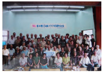
45周年記念合同敬老会