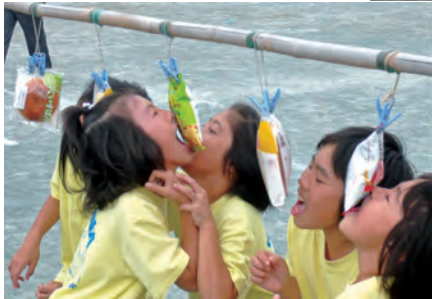
さて、どちらがゲット?