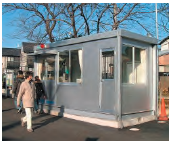
香川駅隣のサクラハウス