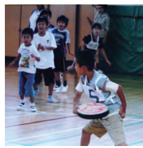
楽しいスポーツ大会

これらはすべて地域の方の温かいご支援で成り立つ行事です。子ども会としては、駅前清掃や地元のお祭りへの積極参加を通して感謝の気持ちを表し、あわせて地域の方々とのふれあいを大切にしたいと思っております。子ども達が大人になった時、自分自身の経験から地域の子ども達に暖かいまなざしが向けられる人になってくれることを願ってやみません。