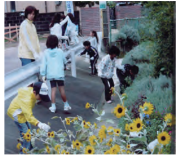
美化キャンペーン風景

行事が終わるたびに会員の理解と協力の必要性を感じます。ただ一つの伝達手段である回覧は、必ず見てください。会員の皆様の手で、町づくりの小さな灯火を点け、大きな燈にならせていきましょう。