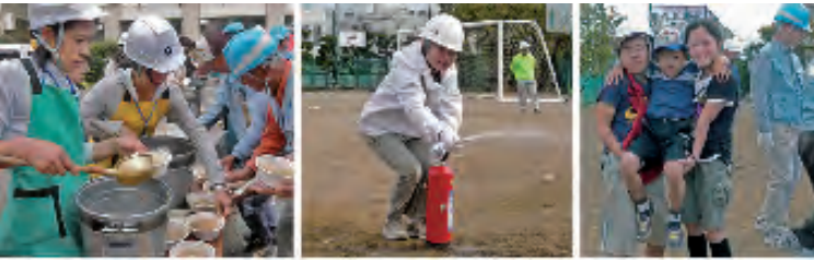
給食訓練(ごちそうさま!) 消火器取り扱い訓練 搬送法訓練