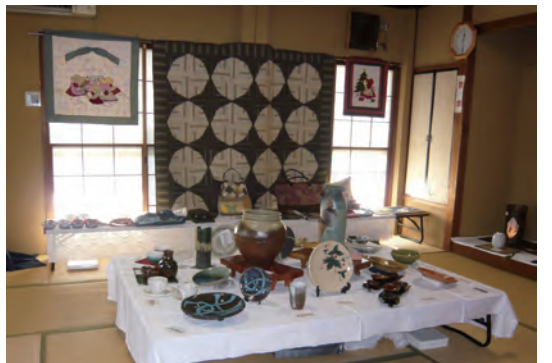
2階で展示された手工作品