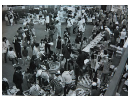
人を楽しませる屋台やバザーなど公民館前の広場

第20回香川公民館まつりが、「地球(ほし)の願いを……」をテーマに10月31日(金)～11月2日(日)の3日間開催されました。実行委員会による企画展示と、香川地区で活動している同好会やクラブの皆さんによる作品展示および講義室では踊りや合唱、演奏発表がされました。屋外では香川自治会をサポートしている湘北社協、レディース香川、体育振興会等の皆さんによる屋台やバザー、餅つき大会などが行われ、好天にも恵まれ、大勢の方々が来館し催しを楽しみました。