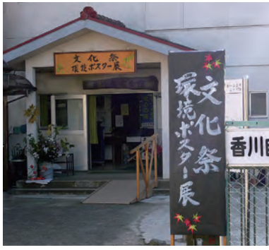
看板も目立ちます

ました。一階展示コーナーでは、絵手紙、鎌倉彫、粘土の花、写真や、子供達の習字などの力作が展示されました。また、いろいろな体験コーナーも用意されました。