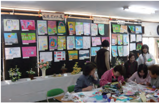
ポスター展の前で和紙ちぎり絵を習う人達

今回の共同開催に当たっては、昨年の反省から、両展を有機的に結びつける新しい試みが期待される中、町内会役員や部長からの提案がありました。実施までの準備期間が短いことから、来年度に再度検討をすることとなり、昨年と同様の展示となりました。一階の環境ポスター展では、地球環境を守ることをテーマに、四つの子どもの子供達が書いたポスターが、パネル一杯に展示され