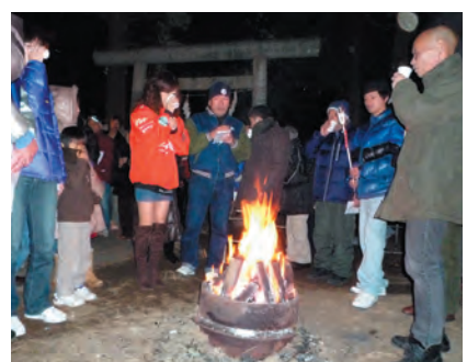
参拝の後、たき火を囲み温かい甘酒で「新年おめでとう」

遠くに除夜の鐘の音を聞きながら、諏訪神社の境内は、新年を祝う初詣の参拝者で、2時近くまで賑わいました。