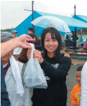
ジャンケンでスマイカを