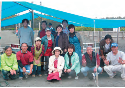
ふれあい部会の皆さんお疲れ様でした

しかしその雨もやがてやみ、なんとか地引き網大会は無事に終了することができました。しかも終了を待っていたかのように、雨が本降りとなったのでした。ふれあい部会の皆さんの感想も、とにかく