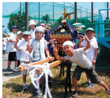
元気に子ども神輿も参加