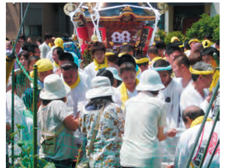
お休み所でのどを潤します

宵宮祭では香川祭り囃子保存会の人達による祭囃子の奉納を口々に、歌自慢、芸自慢の方々20組以上が演芸を披露。大勢の見物人から拍手をもらいました。翌日には、朝8時に諏訪神社を宮立ちした御神輿は第4町内会を巡行。諏訪神社で昼食休憩後、午後からは第3町内会へ巡行が行われました。先々にお休み所が設けられ、町内会の方々による飲食の接待に乾いたのどを潤しながら、無事に午後3時宮入となりました。夕方からは恒例の一座が芝居を上演し、大祭が終了しました。