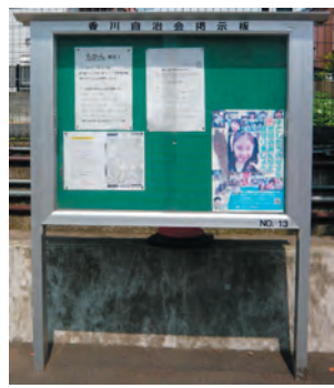
アルミ製の扉つき掲示板

新しい掲示板はアルミ製で、かつ透明の扉つきのため従来のように汚れたり濡れたりする心配がありません。今年度分は10月までに古くなった掲示板が撤去され新しい掲示板に交換されます。これにより第一町内会に設置されている掲示板の交換はすべて終了し、すべて新しい掲示板になります。