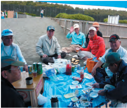
宴会も楽しみの一つです