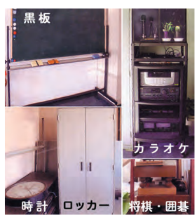
黒板、時計、ロッカー、将棋・囲碁