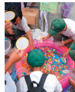
昨年の福祉ふれあいまつりで1コマ