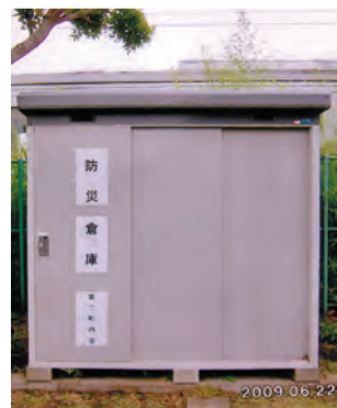
完成した防災倉庫

◇8月未定 親子で竹とんぼ作り ◇8月8・9日 福祉ふれあいまつり ◇7月20日 浜降祭 ◇7月20日 福祉ふれあいまつり