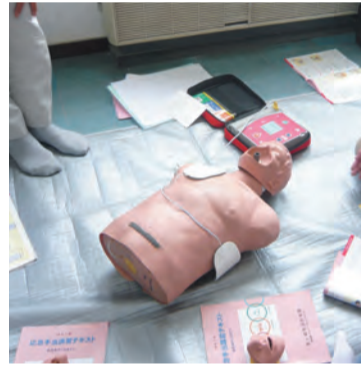
AEDの電極パッドを貼る位置

6月20日(土)第一町内会主催で「救急救命講習会」が実施され、今回初めてAED(自動体外除細動器)の講習が組み込まれました。心臓停止後約3分で50%が死亡するといわれ、その対策として二〇〇四年以来、公共の場にAEDの設置が進められています。AEDは、心臓が小刻みに収縮をくり返し、全身に血液を送ることができない状態(心停止の一病態)を起こしている心臓に対して有効な装置です。正常な拍動をしている心臓や完全に停止しているおよび他の不整脈を起こしている心臓に対しては、AEDの診断機能「除細動の必要なし」の診断を下し通電は行われません。その際は通常の心肺蘇生法等による救命処置を行う必要があるため、必ず従来の心肺蘇生法と組み合わせて使用されるものです。AEDは、傷病者に装着すると自動で「電気ショック」が必要かどうかを判断し指示してくれるので、