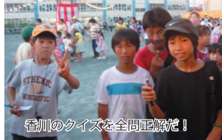
香川のクイズを全問正解だ！