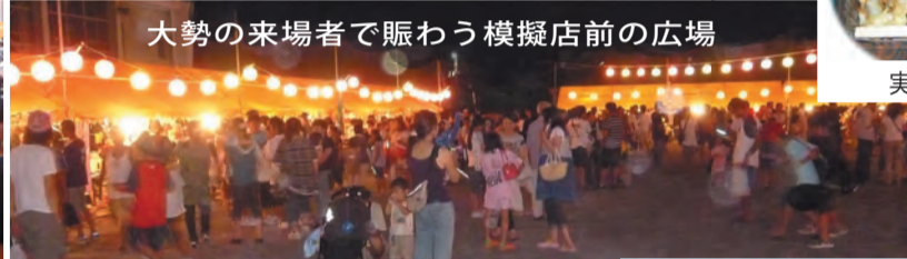
大勢の来場者で賑わう模擬店前の広場