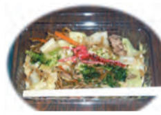
実行委員会謹製 焼きそば

今年文化厚生部会だけの運営でなく、実行委員会形式でたくさんの方針で準備会を含めて、4回の実行委員会を開き、準備を進めてきました。関わる人たちが多くなれば、たくさん意見が出て