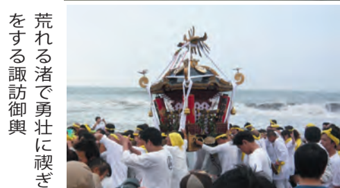
勢揃いし、お供え物を受ける御輿群 荒れる渚で勇壮に裸ぎをする諏訪御輿