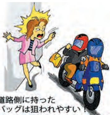
道路側に持ったバッグは狙われやすい！