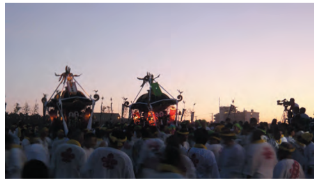
TVカメラも追う、諏訪一番御輿の勇壮な練り歩き

き、その後トラックとバスに分乗し茅ヶ崎の西浜前の道路に集結。浜降祭は心身の罪やけがれを清める「みそぎ」の神事を行うため、海中への渡御が行われることでも有名ですが、今年は波が高く危険な状況。それでも午前四時、夜明け前に浜降祭の一番御輿となった諏訪御輿は、波打ち際を波に洗われながらも「どっこい、どっこい」と浜降祭神輿独特の掛け声も勇ましく砂浜狭しと勇壮に練り歩きました。