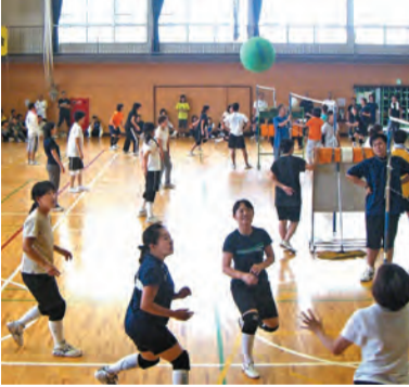
さあ、レシーブからアタックへ!

順位判定は、勝ちセット数の多いチーム、同数の場合2セットの合計点数の多いチーム、それでも同点の場合は選手のジャンケンで決めました。