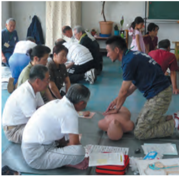
心肺蘇生法の習得は必須