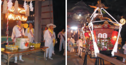
出発を告げる自治会長 宮立ちを待つ御輿

午前8時に神事が終了し、午前11時には香川地区で巡行を行い、無事に宮入となり浜降祭は滞りなく終了となりました。