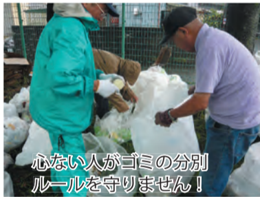
心ない人がゴミの分別ルールを守りません！