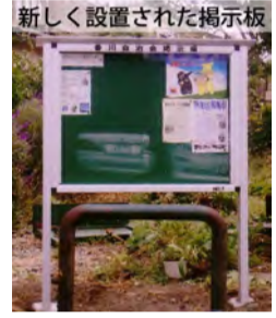
新しく設置された掲示板

願いたします。組長さんをはじめ、会員の方が参加されることを切望いたします。 11月には例年のとおり、第三町内会と合同で「芋煮会」を開催する予定です。イチョウが黄ばむ秋の一日、お気軽にお出かけください。(詳細につきましては回覧にてお知らせいたします。) 皆様のますますのご健勝を祈念いたします。