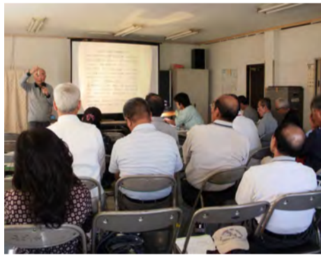
講演に聞き入る自治会会員

10月10日(土)、自治会館において全国瞬時警報システムの運用を8月3日に導入しました。震度4以上に對し早ければ地震が感じられる30秒前に放送されます。 ・備蓄品の飲料水について講師からの提案。 ◎トイレの洗浄水は、使用のたびに更新され最も新しい水であるので、飲料として利用できる。 ◎水の保管は給水用のポリタンクをよく洗浄して空気が残らないように水道水を入れて密封し、黒色のビニール袋で包むと、3年間は変質せず利用できる。 どちらも利用する際は煮沸する必要があるのでそうす。 また、参加者27名の中に、チリ地震の津波により、石巻で被害に遭われた方がおられ、被害の模様をうかがいました。防災の状況が現在とは違いますが、改めて自然災害の恐ろしさを実感しました。 よく言われることですが、地震や津波は突然やってくるので、今回の講座に参加し、心構えもさることながら、命を守る対策がより大切なことと痛感しました。