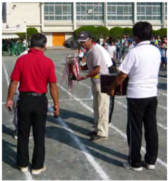
準優勝のトロフィーです