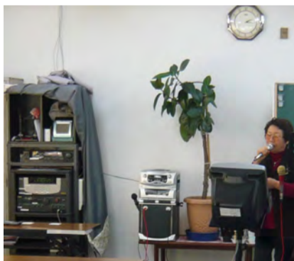
早速活用しています

なお、本設備は通信カラオケの提供会社と利用契約をするため、月々の負担金がかかります。そのため来年1月より、第一会議室のみ部屋使用料金を現在の1500円から改正以前の2000円に戻