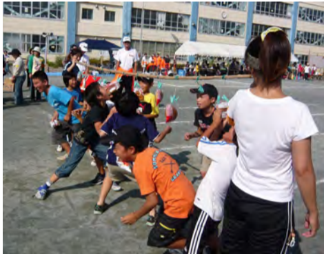
パンくい競争はいつも大人気