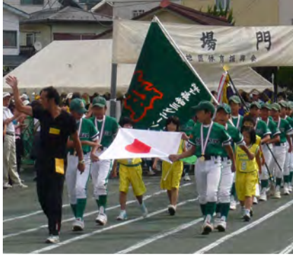
開会を告げる国旗の入場

10月4日(日)、香川地区の自治会合同の体育大会が香川小学校の校庭で行われました。