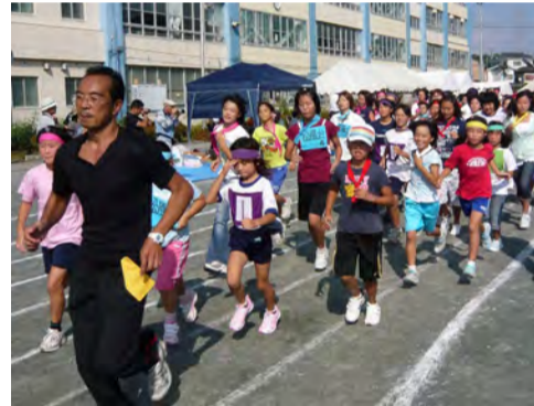
町内対抗リレーの選手入場