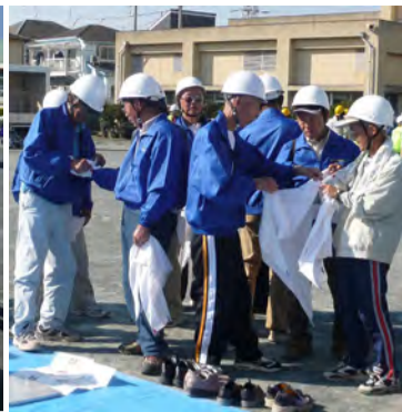
三角巾取扱い訓練