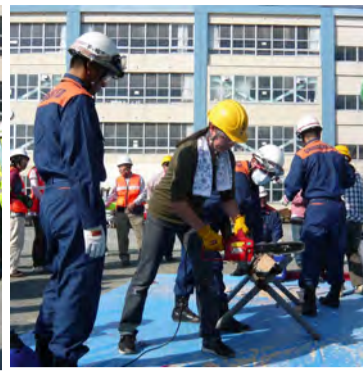
チェーンソー取扱い訓練