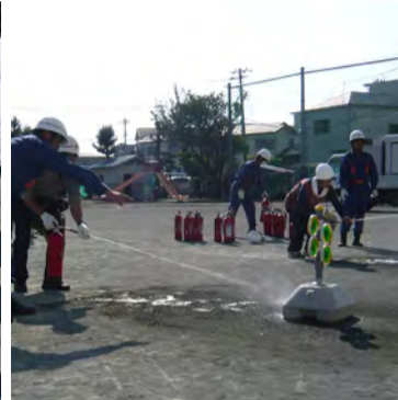
消火器取扱い訓練