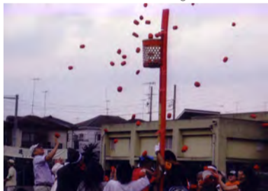
1位を獲得した玉入れ