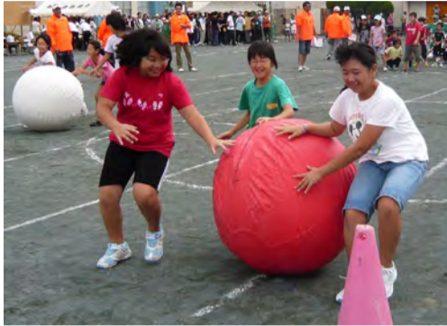
3人が協力して大玉を運びます

前日までの雨模様への心配を一扫する秋晴れのさわやかな青空の下、香川地区体育振興会主催による第41回香川地区体育大会が香川小学校の校庭で開催されました。毎年大いに盛り上がる町内対抗戦は、香川地区の自治会として今年から新たにみずき自治会が参加し、7町内会により行われました。また、今年新しい競技種目として、町内対抗二人三脚リレーおよび防災バケツリレーが加わり、各町内会から熱い声援が送られました。バケツリレーの皆さん、後で腕は痛くなりませんでしたか。