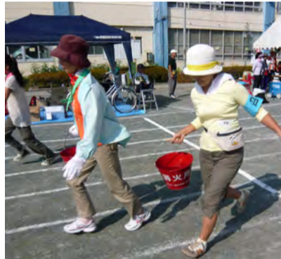
水一杯の重いバケツをリレー