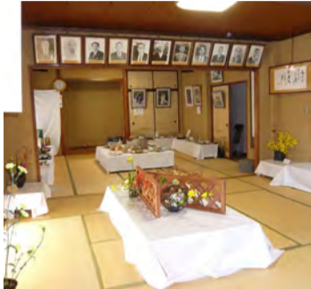
陶芸、活花、書道作品等