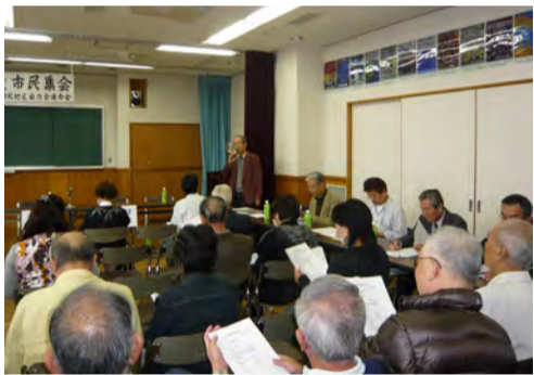
湘北地区自治会連合会役員の方々