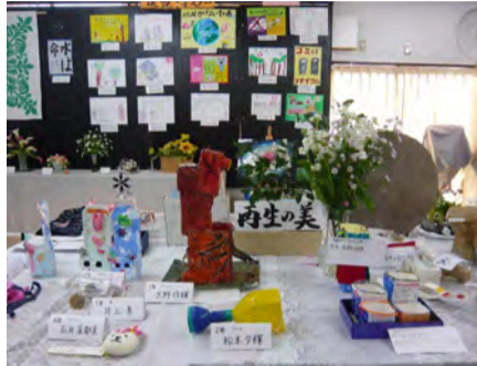
環境作品展のコーナー