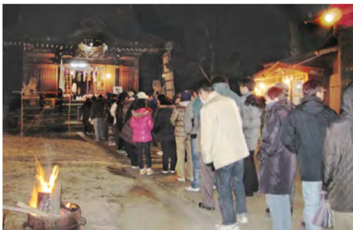
参拝で賑わう諏訪神社

香川自治会は今年、役員改選の年。遠くに除夜の鐘の音を聞きながら前途洋々たる香川の発展と、安全・安心のまちづくりがますます順調に進展することを祈念して、神社の熱い甘酒に舌鼓を打ったことでした。