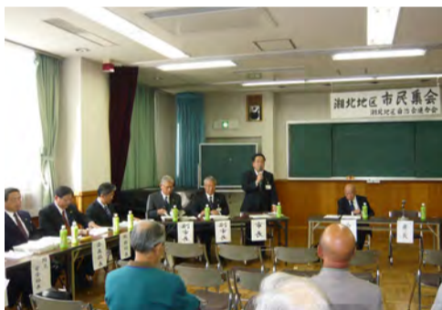
市長ほか市役所幹部職員の方々