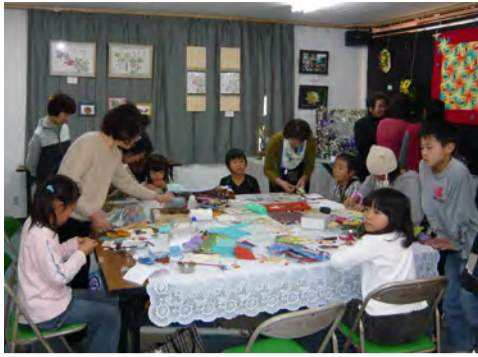
賑わったちぎり絵の体験コーナー

初めての方の参加も少しずつ増えており、その中に若い方の参加もあり輪の広がりを感じます。全体を見ていると、出展作品の数々に積み重ねてきた歴史の重みを感じさせられ、なかなか落ち着