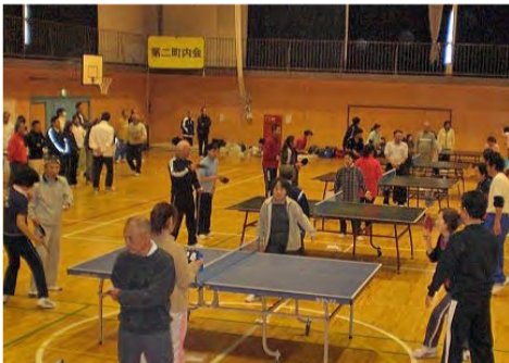
白熱したゲームで盛り上がりました

「年一回、この大会が唯一の参加でラケットもほとんど握ったことがないので」などの話も聞かれましたが、試合が始まると真剣そのもの。迫力のあるプレーが展開され、セットカウント2対2の最終セットまでもつれる白熱した