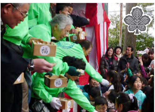
香川商興会の協力で、福は内!

2月3日、この時期にしては温かな日和の中、午後3時から諏訪神社において、節分祭が執り行われました。その後お楽しみ豆まきは、お菓子を袋に一杯もらおうとする沢山の参加者でにぎわいました。