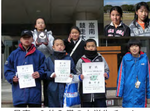
見事、3位入賞の小学生チーム