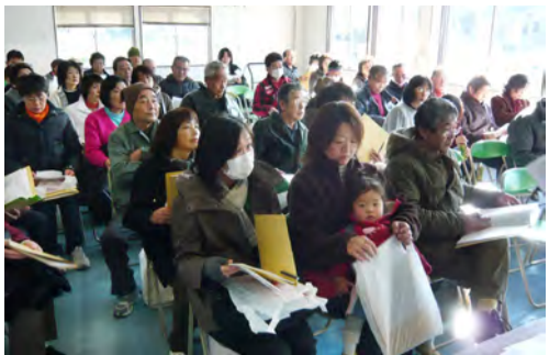
組長の役割を確認する新組長の方々（第一町内会新組長会風景）