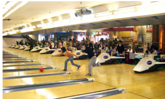
レーン一杯に、大会は盛況でした