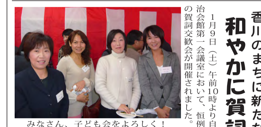
みなさん、子ども会をよろしく！

てチヨロ、こつち見てチヨロで一体何処いくの？ではね。平和日本どうなるの？ですかね。 平和と言えば、近年日本国民に対する諸外国のメッセージが種々来ている様で、某週刊誌の中に拾った面白くも納得する部分を抜粋してみよう。多くはマイナースポット(悪化部分)現象をリアルに表現した外人記者の言葉である。 【日本国民は自由と平和の後遺症と言う病に侵されて居る事すらに気付く事なく、只平和の中にどっぷり漬かっている平和漬け物生活に甘んじて居るようだ。 その結果、平和ボケから平和馬鹿に成り下がり、情報スパイ、多種多様な犯罪、国壊し等何でも出る犯罪自由国家日本のレッテルを貼られての国となった。自国の危機感など毛頭ない国民性は我々の国では考えられない姿でもある。原因のそこには自己中心の感覚が