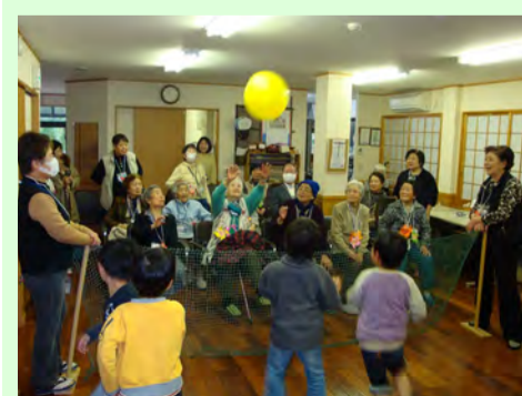
楽しい催しを企画開催