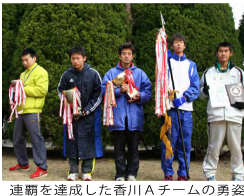
連覇を達成した香川Aチームの勇姿