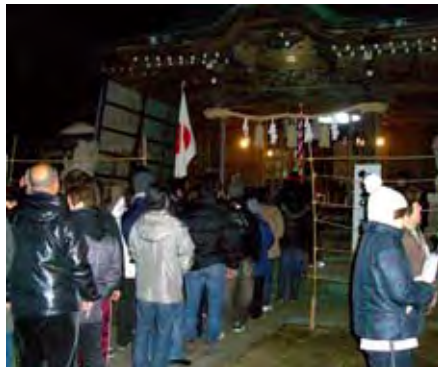
それぞれの願いを込めて!

参拝の後は、熱い甘酒に元気をもらい新年をお祝いしました。今年はずいぶん。跳ねるのが得意なうさぎのように、香川自治会も新しいことが始まる飛躍の年となりそうです。