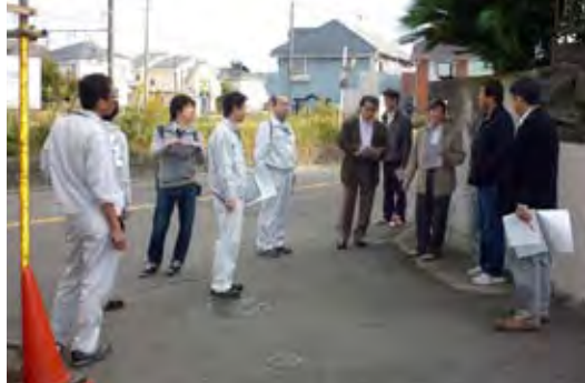
現状の確認を行う検討会委員

また、香川駅の南北両踏切りでは、車との通行区分がないため、歩行者は危険な思いで横断しています。現状を改善するためには、鉄道会社に理解と協力を求めている必要があると委員一同認識しました。(香川自治会 東委員 記)