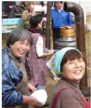
お手伝い、ありがとう！