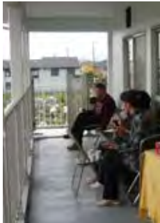
ベランダで休憩 (会館まつりにて)