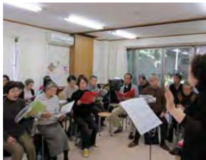
熱心な指導で楽しい練習

団員は、カラオケマイクしか持ったことなかった人、数十年前に歌い始めた人、歌が大好きな人など多彩です。