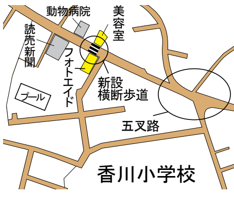
横断歩道の設置場所

■先号で開催日を11月28日と誤ってお知らせしました。お詫びして訂正いたします。