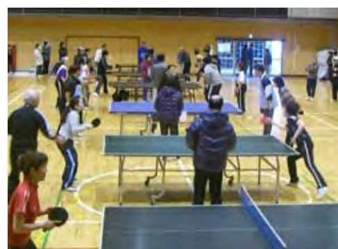
熱戦にわいた試合風景

試合は5セットマッチ3セット先取の方法で行われましたが、昨年以上に白熱した熱戦が繰り広げられ、2対2の最終セットまでもつれた試合が多数ありました。