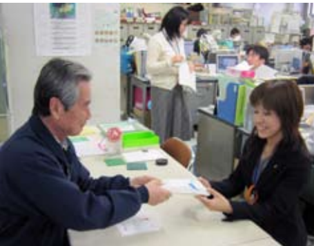
東日本大震災の義援金を市役所に!

◎香川駅前通りの安全確保 駅前通りの安全確保の一環として、今年度は静岡中央銀行前から駅北側踏切を渡った先の十字路までの、約160メートル分の舗装改修が計画されており、歩行者が歩きやすい道路に改修されます。この工事が完成しますと、大山街道から北陵高校前までの自動車の制限速度が、40キロから30キロに減速されることになっていて、歩行者や自転車の安全確保に寄与できると考えます。