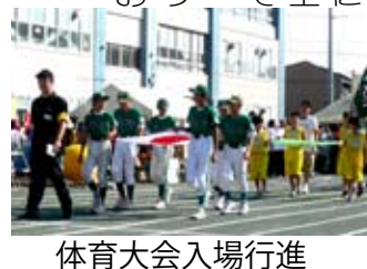
体育大会入場行進

面にわたる健康の維持増進に寄与するものです。」これは、平成22年10月茅ヶ崎市作成の「スポーツ振興基本計画の趣旨」の引用ですが、体振もこの趣旨に則り、一人でも多くの人が、気軽にスポーツを楽しめる場を提供して参ります。各町内会から選任された8名ずつの役員がお世話をしますので、気軽に声をかけてください。スポーツを通して香川の住民同士が益々の交流と親睦を図れたら、私たちにとってこの上もない喜びです。体振をどうぞよろしくお願いたします。