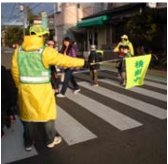
誘導中の隊員の皆さん

面にわたる健康の維持増進に寄与するものです。」これは、平成22年10月茅ヶ崎市作成の「スポーツ振興基本計画の趣旨」の引用ですが、体振もこの趣旨に則り、一人でも多くの人が、気軽にスポーツを楽しめる場を提供して参ります。各町内会から選任された8名ずつの役員がお世話をしますので、気軽に声をかけてください。スポーツを通して香川の住民同士が益々の交流と親睦を図れたら、私たちにとってこの上もない喜びです。体振をどうぞよろしくお願いたします。