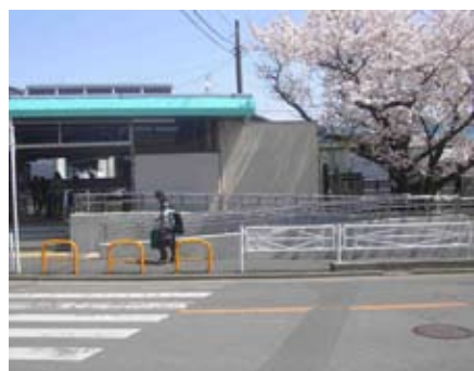
スロープが設置された香川駅前