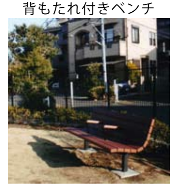
背もたれ付きベンチ