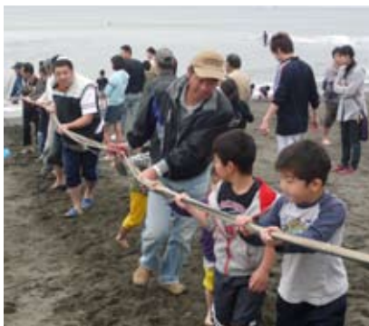
この地引網はきっと大漁だ!