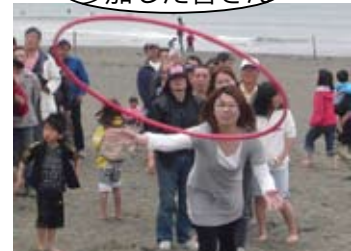
釜揚げシラスに挑戦