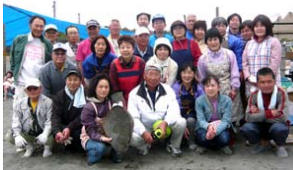
役員の皆さんお疲れさまでした

今年は、釜揚げシラスを製造する業者がお休みというアクシデントがありました。役員の方々の果敢な挑戦により、プロに負けないういしさの、手作り釜揚げシラスが提供されました。