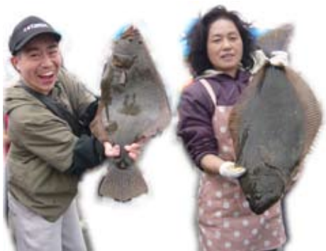
大物ゲット!おめでとう