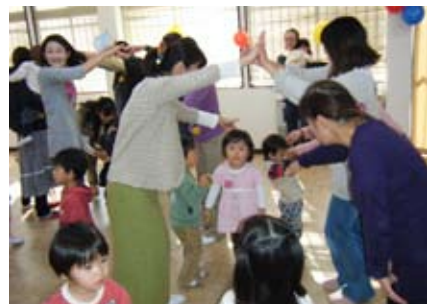
親子で楽しくリズムダンス