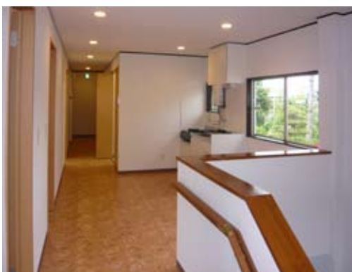
二階の階段から廊下を望む