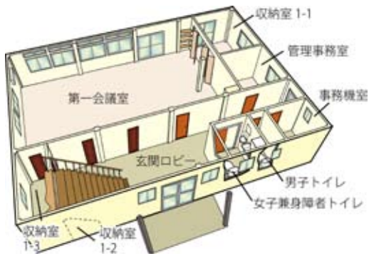
一階フロアの俯瞰図