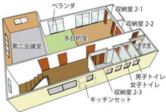
二階フロアの俯瞰図

・廊下と部屋の段差を無くしたうえで、履き物を脱がずに入室できるようにしました。 ・畳マットを用意し、一部を和室として使用も可能にしました。 ・第2会議室の改修 他の部屋の影響を受けないように独立した会議室に変更し、使いやすいにしました。