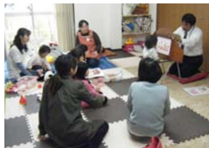
紙芝居のおじさんがやってきた!