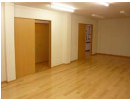
多目的室から廊下を望む