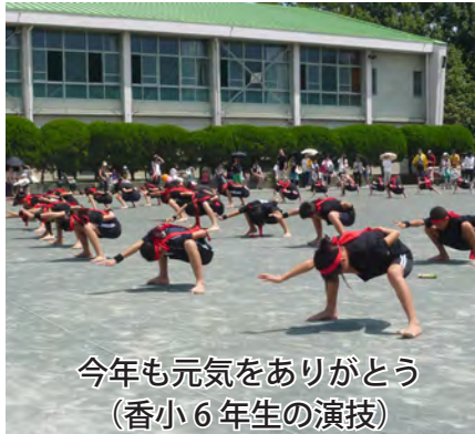
今年も元気をありがとう(香小6年生の演技)