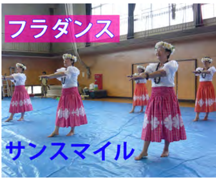
フラダンス サンスマイル