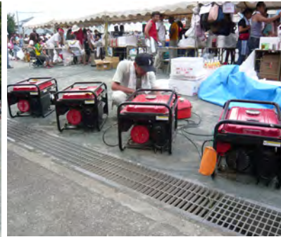
自前の電気に発電機を活用