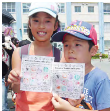
スタンプラリーでクジをひくよ～