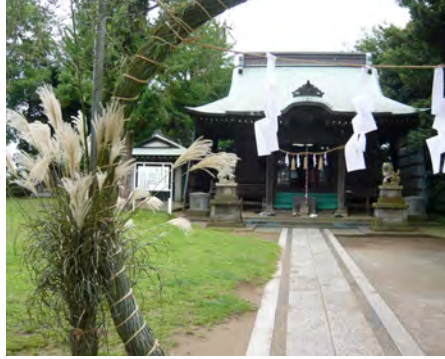
茅の輪から諏訪神社を望む

夏越祭は夏越しの大祓とい、諏訪神社では、戦没者慰霊祭と夏越祭を合祀するため、毎年8月14日に行っています。夏越しの大祓では「茅の輪くぐり」を行い、氏子の方々が茅草で作られた大きな輪の中を左まわり、右まわり、左まわりと8の字に3回通って健康を祈念します。