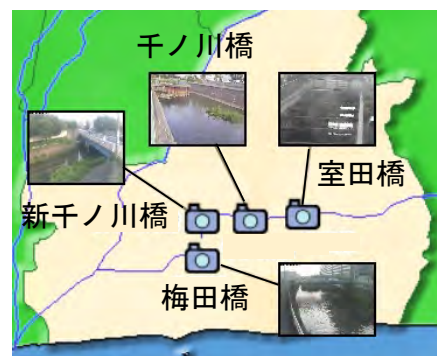
茅ヶ崎ライブカメラ位置 (洪水)