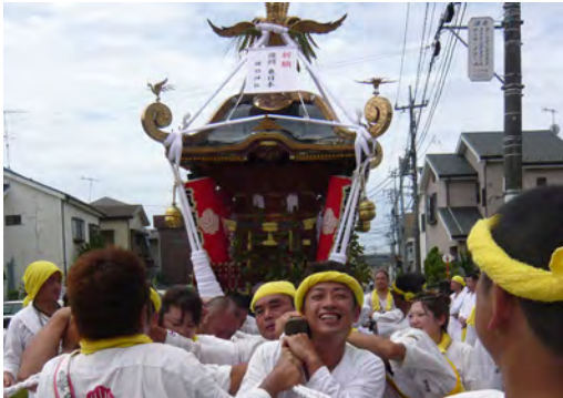
香川町内を巡行する神輿

しかし、各神輿保存会からの強い要望により、東日本復興を祈願する祭事を兼ねることで、ほぼ例年通りの規模で実施されました。