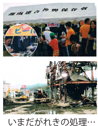
いまだがれきの処理...

の小学校では暖かく迎えて頂き、支援物資を手渡し、トラックで運んだ神輿を担ぎました。今、現地の人から言われた一言が忘れられません。「いつ来るかわからない義援金よりも、目の前にある物資の方が遙に嬉しいし、神輿を元気に担いでいる皆さんを見て、心が温かくなり、心に元気を貰った。」の言葉