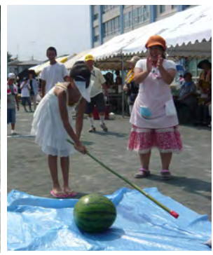
お楽しみは後のスライカ!

また二日間でお祝い金212,000円とその他団扇、飲み物等を頂きましたことをご報告するとともに、お礼を申し上げます。みなさんの感動と笑顔をありがとうございました。また来年、香川ふれあいまつりで会いしましょう。