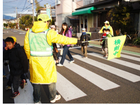
子ども安全見守り隊の方々のボランティア活動