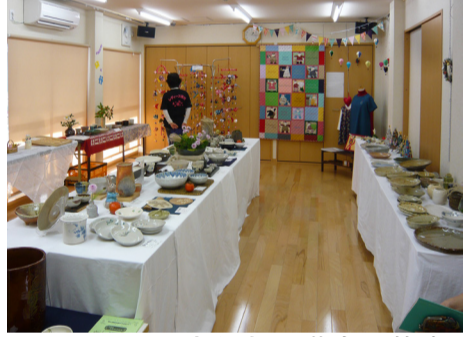
リフォームされた2階多目的室 (自治会館まつりにて)

平成23年度(平成23年4月～24年3月)の香川自治会の活動は、昨年4月27日に行われた総代会で承認された活動計画に沿い、進められてきました。 主な活動の概要は次の通りです。 ●自治会館リフォーム工事 会館の老朽化の対策として平成22年の第一次、第二次リフォーム工事に続き、5月から6月にかけて本館2階の和室の改装を中心に、いくつかのリフォームを行い、第3次で自治会館の老朽化に対する対策は完了しました。 ●防災組織の充実 長年懸案となつていた、新設の防災部会が4月に発足し、各町内会から選出された防災リーダーを中心とした、8名の体制で活動をはじめました。 ●香川まちづくりへの取り組み 公園設置の要請に対し、4月には香川第一、第三青少年広場が公園化されました。 ●香川駅前周辺の整備計画の一部として、7月には新駐輪場も完成し、放置自転車禁止区域にたいする、監視員による放置自転車のパトロールが始まりました。6月から9月にかけては、駅前通りの道路改修、舗装工事も行われました。 ●また、町内各所の防犯灯を、蛍光灯から明るいうえに省エネタイプのLED灯へ、取り替え工事が進められています。 ●東日本大震災への義援金支援 東日本大震災の被災地への義援金募集をいち早く行い、集まった