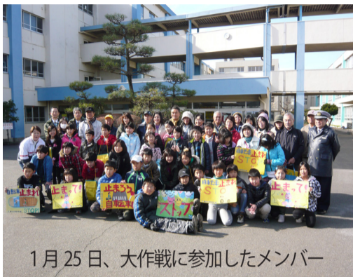
1月25日、大作戦に参加したメンバー

香川自治会・各町内会から、サポートメンバーが参加し、子供達の安全を確保し、大作戦を支援しました。