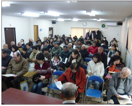
新組長会議の様子 (第二町内会)

平成24年1月21・22日の土・日の2日間、各町内会ごとに4月からの新年度に備えて、新しい組長さんを対象にした組長会が、香川自治会館で開催されました。 新組長会では、所属する町内会の中で輪番により選任された新組長さんが、お仕事の確認と共に、組長さんの代表となつて自治会の議決機関である総代会に出席する議員さんを選任しました。 また、この組長会の冒頭に4月より市の回収資源物が追加拡大される説明が行われました。 ●組長さんのお仕事(要約) ①組長札の掲示 ②自治会への入会・退会の届出 ③連絡書類の回覧および配布 配布物は、かならず個別に配布