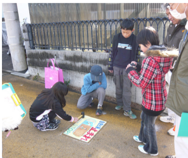
路面への貼りつけ作業をする生徒達

◆勘重郎掘跡地・散策路整備について 勘重郎掘跡地は、香川自治会の管理として委託された散策路ですが、植物の繁茂する季節には、部会役員の人力だけでは対処しきれない負担となっております。