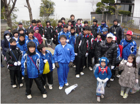
第一町内会(1丁目)の美化グループ

香川小学校区地域美化活動に協賛・参加 本イベントは、地域の美化を通じて、地域中学・小学校の生徒・児童が、近隣住民とのコミュニケーションを図れる場として、また地域の一員であることの意識の向上、ボランティア精神の向上などを目的として、香川小学校区青少年育成推進協議会により企画・実施されたものです。 昨年までは、鶴が台中学校のボランティア活動として行われていた地域美化活動。今年度は青少年育成推進協議会が主催団体となり、香川小学校区に所在する各自治会にも参加を要請。香川自治会としても協賛し、4町内会ごとに役員や会員が協力、参加しました。 自治会参加者は、香川小学校の出身から、鶴が台中学校へ到着まで引率の間、参加した生徒・児童とボランティア活動や、普段はできない活動も、参加しました。 実施内容 ・日時 平成24年1月21日(土) ・集合 9時45分 香川小学校 ・出発 10時 各町内会毎に ・解散 11時半 鶴が台中学校 ・解散後 トン汁 第一町内会(1丁目)の美化グループ