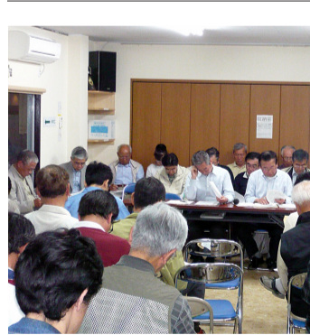
狭くて段差が激しい大山街道の歩道

3 香川小学校通りの道路改修 狭い香川小学校通りですが、ある区間の下水道改修工事が完成し 4 香川駅前通りの道路改修 昨年度は、香川駅前から北側の駅前通りの舗装改修が行なわれ、今までより歩行者が歩きやすくなったと感じています。 今年度は、静岡中央銀行前からすずめん香川店までの駅前通りの道路舗装改修工事が計画されています。駅前通りを香川駅に向かう人、駅から大山街道方面に向かう人たちの安全確保を目指したいと考えます。(山本 茂樹)