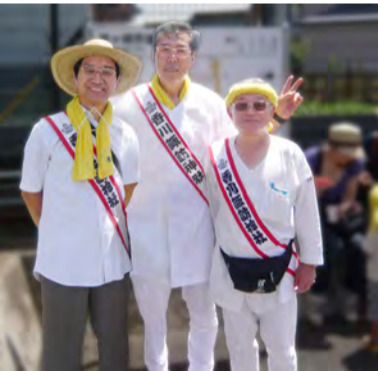
浜降祭をサポートしました

第四町内会では、そのきっかけの一つに、10月14日の体育大会では、競技に参加する人と応援する人が、同じ目標に向かって一致団結したいと考えます。皆様、ご協力のほど宜しくお願い致します。 最後に組長の皆様には、6ヵ月間、それぞれの組内の取りまとめにご尽力戴き感謝します。残りの6ヵ月も宜しくお願い致します。 住んで良かったという街づくりのために…。(椎野)