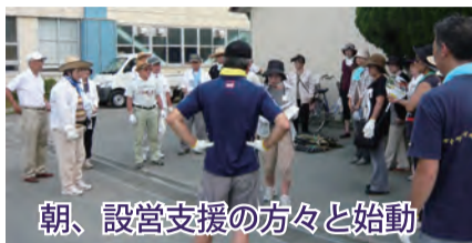
朝、設営支援の方々と始動

8月4、5日の香川ふれあいまつりが、自治会の皆様、役員の方々、模擬店出店、イベント出演の方々、自治会関係諸団体の方々のご協力、ご参加によって無事終えることができました。 香川小6年生によるソーラン節をはじめ、イベントに出演していただいた方には、暑い中楽しく演技を披露していただきました。ありがとうございました。 またリトルタイフーンの皆様には、突然の大雨の中、中断を挟みながらも笑顔で踊っていただきありがとうございました。 入場者数は、1日目が1670名のところで雨のため、やむを得ずカウントを終了し、2日目はおよそ900人の方が来てくださいました。