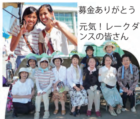
募金ありがとう 元気! レークダンスの皆さん