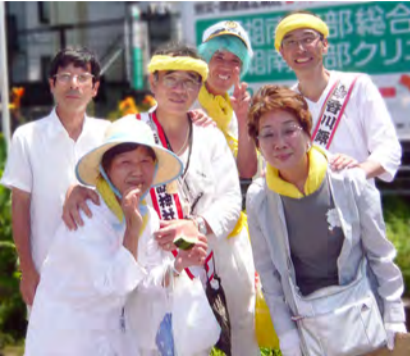
浜降祭をサポートしました

対応して頂き、地主さんとの話で、資源物の置き場所も解決しました。ごみと資源物は、住民一人一人がマナーを守り、きちんと出してくださいね。 8月は定例会、防犯パトロールがお休みでしたが、9月より役員、組長さんにはご協力宜しくお願い致します。(香澤)