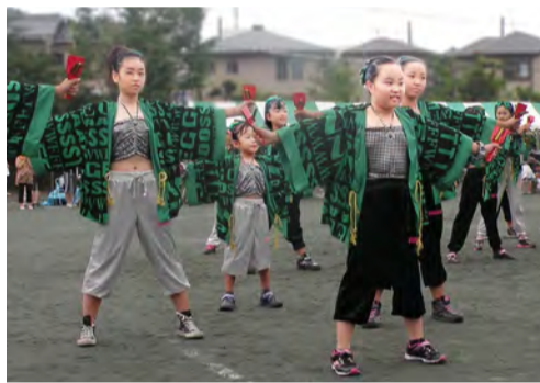
雨の中も笑顔で、リトルタイフーン

との兼ね合いなど検討事項がいくつかあります。予算編成の関係もあり、来年3月までには役員の方やふれあい部会で協議し、決めて行きたいと思っています。 どうぞ来年のふれあいまつりに皆様のご協力、ご参加をお願い申し上げます。また、提案などございましたら12月までに上総までご連絡いただければ幸いです。 最後に、ご寄付いただいた義援金8800円は、昨年同様に福島県双葉町役場に直接届けました。 また、お祝金5000円、団扇、ティッシュ等を頂きましたことをご報告するとともに、お礼を申し上げます。