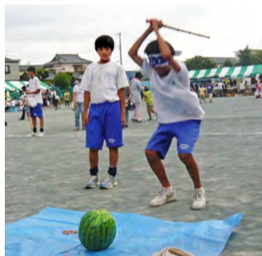
カー杯、スイカ割り