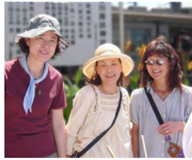
浜降祭をサポートしました

第四町内会では、そのきっかけの一つに、10月14日の体育大会では、競技に参加する人と応援する人が、同じ目標に向かって一致団結したいと考えます。皆様、ご協力のほど宜しくお願い致します。 最後に組長の皆様には、6ヵ月間、それぞれの組内の取りまとめにご尽力戴き感謝します。残りの6ヵ月も宜しくお願い致します。 住んで良かったという街づくりのために…。(椎野)