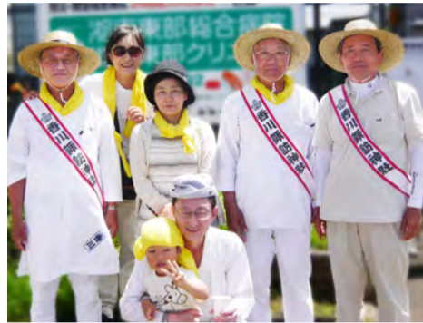
浜降祭をサポートしました

裕を持ち楽しく乗って、自分にも他人にも少し気を使い、「住んで良かった、楽しい・明るい・清潔な香川」にしましょう。 第一町内会では、『防災リーダー』を募っています。詳しくは大淵防犯部会長または町内会長へご連絡下さい。(小川)