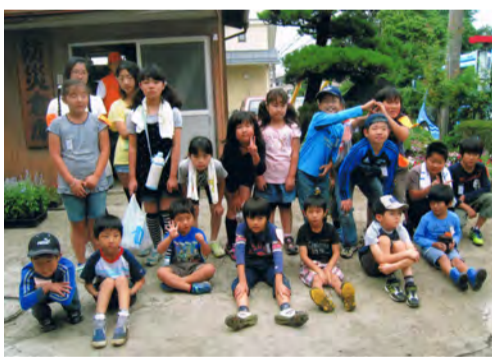
自治会館前で記念撮影