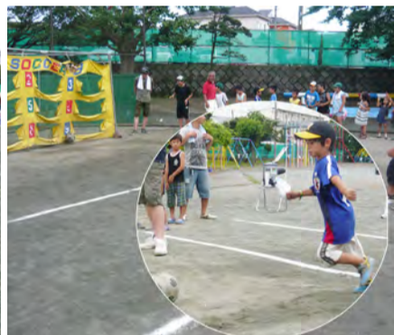
華麗にキック、サッカーナイン