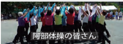
阿部体操の皆さん