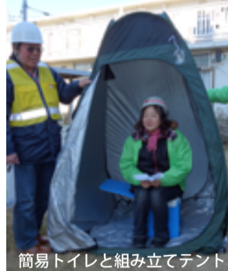
簡易トイレと組み立てテント