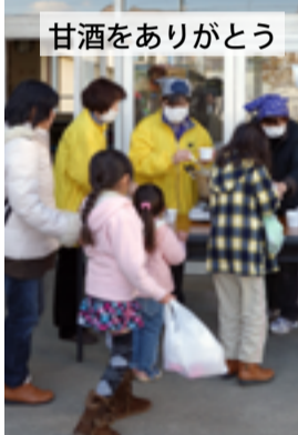
甘酒をありがとう

12月9日(日)、香川自治会初の単独の防災訓練を実施した。昨年発足した防災部会の目標にしてきただけに、感無量である。 今回は初回でもあり、避難訓練と近助、訓練を通じて「近所どうしの意識を深めてもらうこと」を主たる目的として行った。 9時、まず、各町内会は第一次避難場所に集合して、各町内会の計画に基づく防災訓練を行った。 ここで防災倉庫の位置と倉庫内の備品類の確認、発電機や投光機の運転体験、三角巾、簡易トイレ、テントの組み立て、車椅子やリヤカーでの搬送などを試みた。 また、通信訓練として、簡易無線機を利用して対策本部と避難所運営委員の詰めている香川小との連絡、各町内会との連絡を試してみた。いきなりの実施であったが上手く機能したようだ。 予定より30分ほど早く香川小へ集合し、この寒さの中、予定を超える