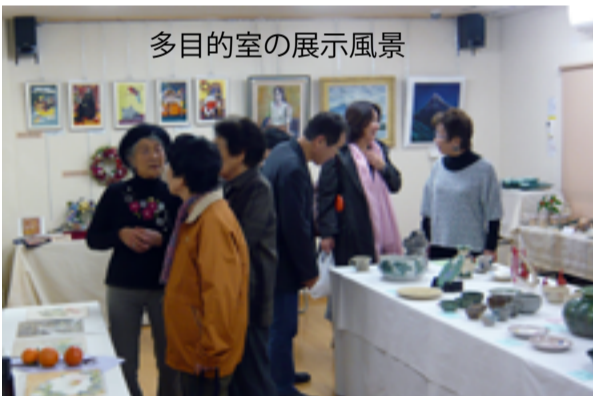
多目的室の展示風景