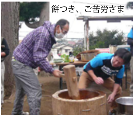
餅つき、ご苦労さま

今年度の防犯灯新設要望の結果 今年度は、茅ヶ崎市に対して防犯灯を23灯新設するように要望しています。 11月9日に安全対策課に確認したところ、予算の関係で13灯の設置とのことでした。設置にならなかった町内会は、来年度に再度申請の検討をしてください。