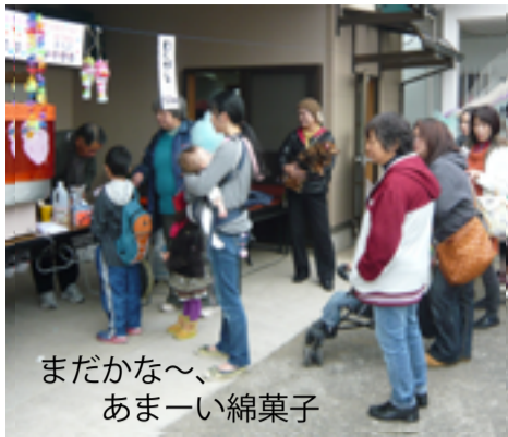
まだかな～、あまーい綿菓子