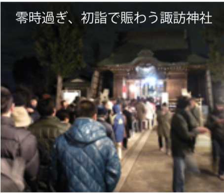
零時過ぎ、初詣で賑わう諏訪神社

平成24年大晦日、天気は良く綺麗な月の出ている中、香川諏訪神社では、合図を待つ初詣の参拝者が零時前から長い列をつくり、参拝をした後は、賀詞交換や振舞われた甘酒で暖をとるなど、多くの人で賑わいました。