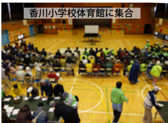
香川小学校体育館に集合

皆さんの意見を参考にしながら、より実践的な防災活動を、防災訓練を、防災意識が高まっている中、次年度に向けて頑張っていきたいと思う。