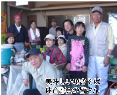
美味しい焼きそば 体育部会の皆さん