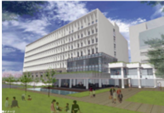
新庁舎の外観イメージ

平成24年11月、茅ヶ崎市は新市庁舎の基本設計を市のホームページに公開しました。