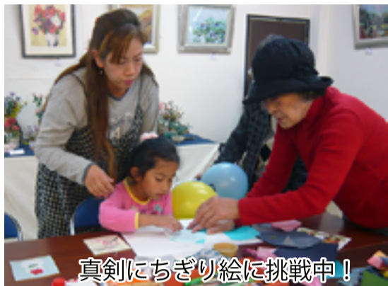
真剣にちぎり絵に挑戦中!

来年度も皆様のご指導、ご協力を頂きながら、より良い自治会館まつりになるように励んでまいります。