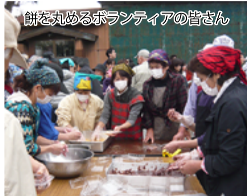
餅を丸めるボランティアの皆さん