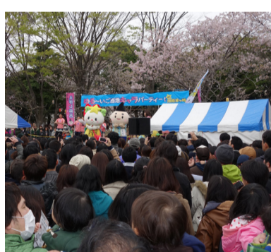
子供達で大賑わいの会場

「ゆるい」当地ゆるキャラパーティー! in湘南茅ヶ崎」が茅ヶ崎市観光協会主催・後援/茅ヶ崎市・茅ヶ崎商工会議所により、平成25年3月30・31日の10時から中央公園で開催されました。