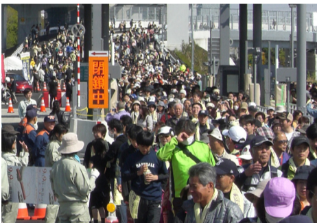
寒川北ICからスタート!