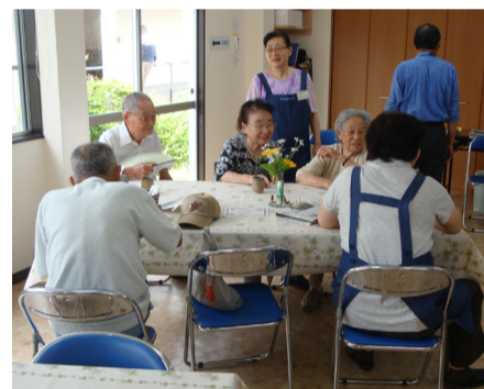
和やかに、楽しく団らん