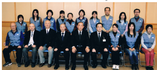
共に学んだグループの人達です