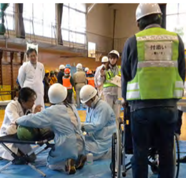
トリアージ訓練の様子

10月20日(日)に湘北地区7自治会合同の防災訓練が香川小学校で実施された。 当日はあいにく雨天で肌寒い日となり訓練はすべて体育館で行うことになった。香川自治会は単独の防災訓練の経験から、靴カバー用にビニール袋を用意していたので靴のまま室内に入ることが出来るといふアイデアが他の自治会から羨ましがられ、高評価を得る結果につながった。 参加者は例年よりも、少なめでしたが中学生を含め全員が真剣な態度で受けていた。訓練は例年行っている三角巾やロープ結索、毛布を利用した搬送訓練などの他、今年度は次の訓練が行われた。