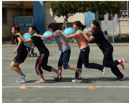
足並みも揃って1位を激走中