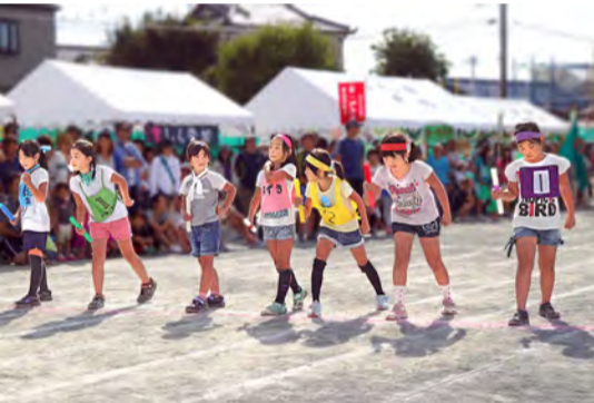
スタート前、緊張の一瞬

発行 香川自治会広報部会 香川の人口 11,628 男性 5,777 女性 5,851 世帯数 4580 (2013.10.1 現在) 印刷所 (有) スエカネ印刷