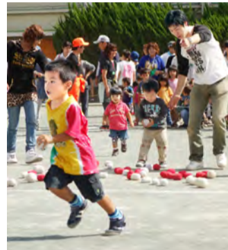
さあ、ゴールに行こうね