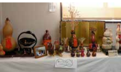
瓢箪の展示コーナー