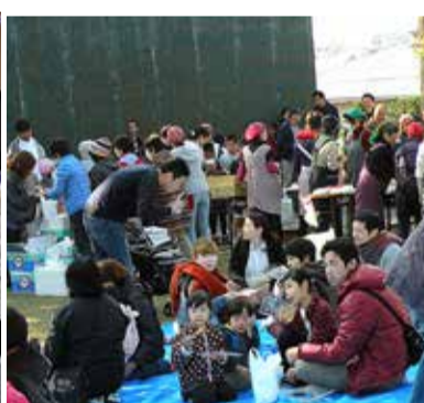
芋煮・餅つきの神社境内会場