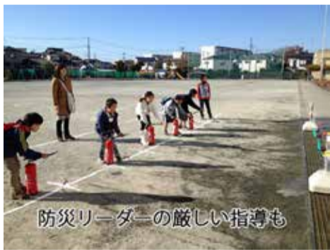
水消火器的当てゲーム・ヨーイ消火

食後は、みつろうの口ウソク作りやミニゲームなどで、また盛り上がりつつありました。子どもたちは満足した様子で、「あいがとうございました。」と手を振っていました。