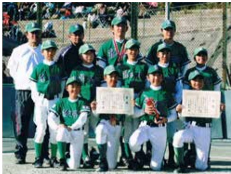
おめでとう！見事第3位

そして、最後の公式戦となった「第33回大磯紅葉山旗杯・神奈川県新聞旗争奪親善少年野球大会」では、県内より67の強豪チームが参戦する中、メンバーが一致団結し激戦を突破していきましました。準決勝にて力尽きてしまいましたが、堂々三位入賞を果たしました。また、4・5年生チームは市北部リーグで優勝、低学年チームは同準優勝など、輝かしい戦歴を残しました。