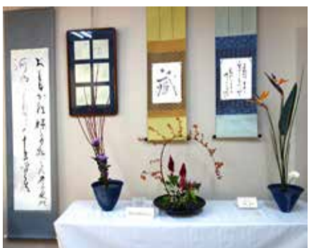
書といけばなの展示コーナー

又、辛味(大根おろし)餅が少なかったり、きな粉餅の甘味が足りなかった等の反省点もありましたので次回の参考にして下さい。お手伝い頂いた皆さん本当にありがとうございました。