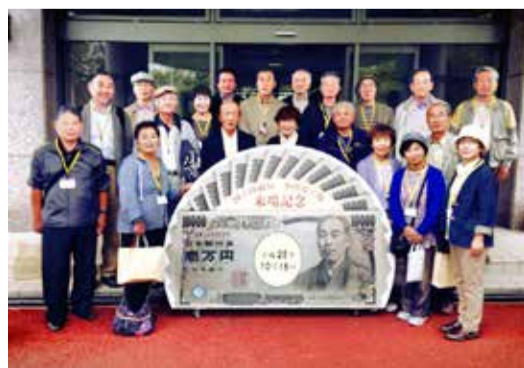
一万円札!を囲んで「はい、ポーズ」

見る角度を変えると、光沢を持った複数の画像が現れますが、コピー機や通常の印刷では、この