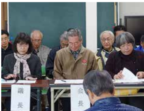
議題を説明する自治会役員

今回の議案についての質問は、事前通告していただくことになっていましたが、特に質疑もなく、原案通り議決されました。 (総務部会長 東)