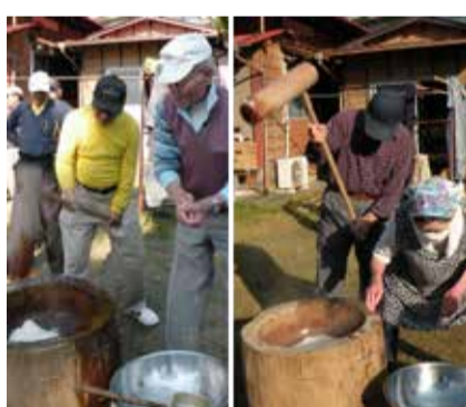
ただいま餅つき中!