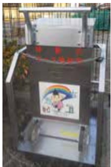
移動式ホース格納箱

● お知らせ 昨年12月6日(金) の夕方、ゆうゆう公園の左側入り 口に、「移動式ホース格納箱」が 設置されました。詳しくは、町内 の役員に問い合わせただけられ ば、ご説明致します。 本年もどうぞ宜しくお願いま す。(香澤)