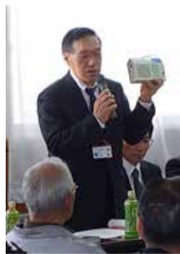
ラジオを手に説明

平成25年11月10日 13時半、 湘北地区市民集会開催 香川公民館において、湘北地区 自治会連合会を構成する、各自治 会地域住民・自治会関係者60名以 上と行政からは部門の責任者が出 席し、開催されました。 ● 今年には質疑の前に、市が新たに 導入した防災ラジオの説明を、担 当の部門責任者が行いました なお、このラジオは、有償(2千 円)ですが、今年度は1次・2次 募集共に締め切られました。