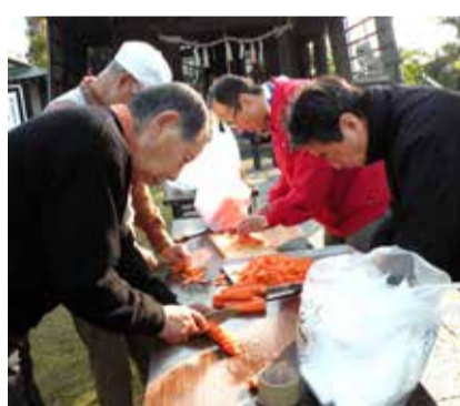
慣れた手つきで?芋煮の下ごしらえ