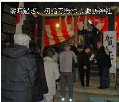
零時過ぎ、初詣で賑わう諏訪神社

大晦日は少し寒波が和らぎ、諏訪神社境内の明かりが暖かそうに照らす中、様々な願いを胸に多くの人が初詣に訪れていました。役員の方々には、お礼やおみくじの販売、甘酒の振る舞いなど、お疲れさまでした。