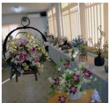
粘土の花のコーナー