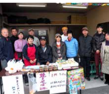
体育部会の皆さん(フードコーナー)