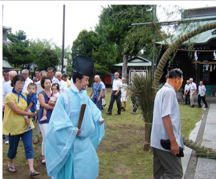
神妙に茅の輪くぐりに参列

大きな茅の輪を作法に従ってくぐり、正月から半年間のケガレを祓い、残り半年の無病息災を祈願するというこの行事は、夏越の祓(なごしのはらえ)とも言われています。諏訪神社では戦没者慰霊祭と合わせて行われています。