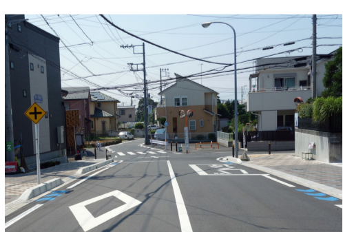
一部が2車線に拡幅された香小通り

◆第1ステップ 2017年のリニア中央新幹線の名古屋開業を見据え、駅行違い施設整備や、信号保安設備改修、分岐器改良等による輸送改善を目指します。