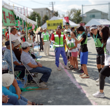
出場選手を紹介中

来てほしくない大震災。私たちが住んでいる香川が巻き込まれた時、一番の心配は『火事』です。 *ガスの元栓を止める *電気のブレーカーを切る 普段からどこにあるか、確かめておきましょう。 明るい清潔な町・住んで良かった香川にしましょう。(小川)