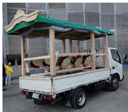
新装の山車と楽器

宝くじの社会貢献広報事業として行われている、コミュニティ活動に必要な備品や集会施設の整備、地域文化への支援等に対する助成に、香川自治会として祭囃子保存会の長岡太鼓他楽器の整備として20万円の申請を行い、抽選に当選。太鼓や当り鉦、篠笛、山車を購入しました。