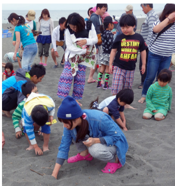
宝探しで賞品をゲット