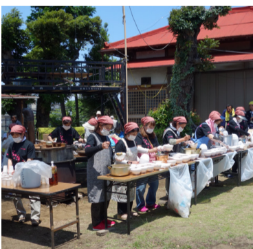
香川レディースの皆さん