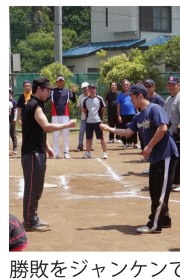
勝敗をジャンケンで