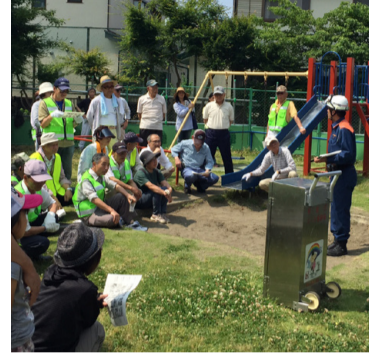
移動ホースの訓練

梅雨空もそろそろ開けて、夏本番という季節となりましたが、会員の皆さまにおかれましては、ご健勝の事とお慶び申し上げます。今年も暁の祭典『浜降祭』が、7月20日海の日に盛大に行われま す。関係者の皆さま、お疲れ様でございます。 また、会員の皆さまには、多額のご寄附を頂き、有り難う御座いました。 相も変わらず、「振れ込み詐欺」「還付金詐欺」等々が横行しています。 電話口でお金のお話が出たら、必ず誰かに話し、相談しましょう。間違えても何も恥ずかしい事ではありません。 5月31日に第一町内会・第二町内会合同で「移動式ホース」を使っ