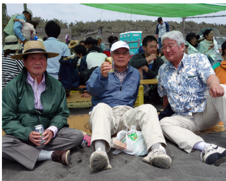
昼間のビールは旨い