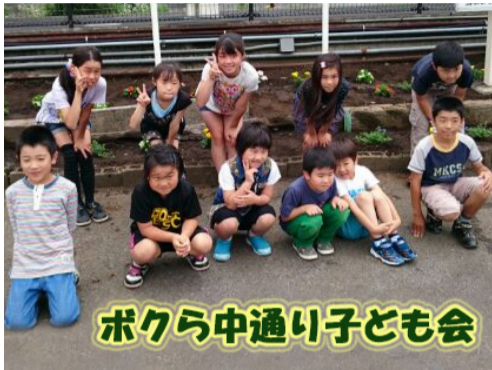
ボクラ中通り子ども会