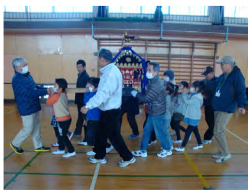
体育館中に「どっこい、どっこい!」

本授業は、生活科目の一環で児童が希望する事柄を先生方が選び、その中で学校内では対応でき