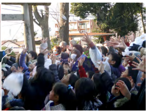
「こっちにも播いて〜」