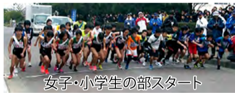
女子・小学生の部スタート