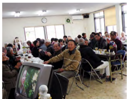
寿クラブの例会風景