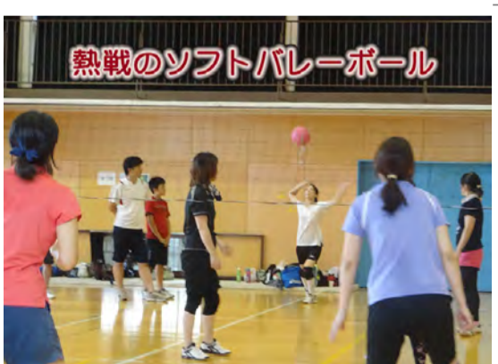
熱戦のソフトバレーボール

今年は引き潮のタイミングと帰路に就いた神輿の禊ぎとが重なり、波打ち際から沖合まで潮が引いた中、各神社の神輿が次々と海中に繰り出していました。