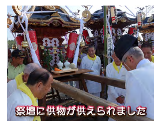
祭壇に供物が供えられました

暁の祭典 ▲ 浜降祭・点描 今年7月18日の浜降祭は、例年通り寒川神社をはじめとして、34神社・39基の神輿が茅ヶ崎海岸に集結。暁の祭典「浜降祭」が挙行されました。 諏訪神社神輿も夜の二時半に宮立ちし、4時過ぎに会場に到着し、会場内を勇壮に練り歩いた後、海に入り勇壮に「みそぎ」を行いました。